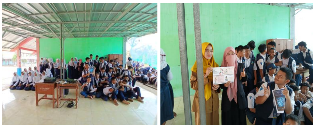
Gambar 2. Foto bersama setelah selesai acara workshop