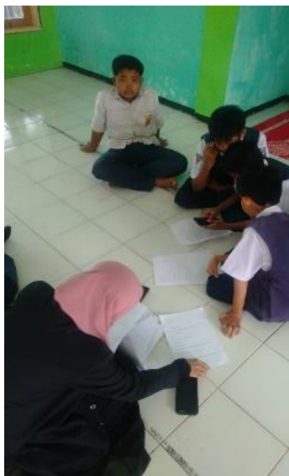
Gambar 3. Pengeditan film