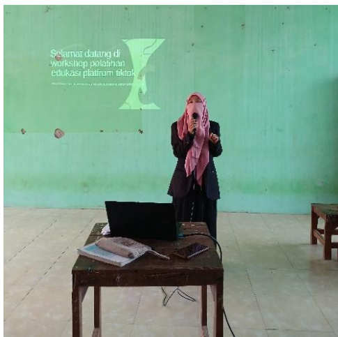
Gambar 1. Pemaparan materi dalam acara workshop