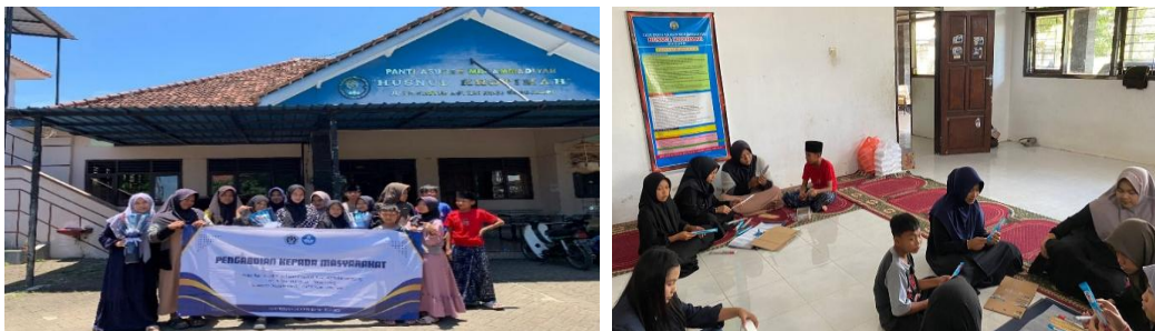
Gambar 1. Kegiatan Pelatihan