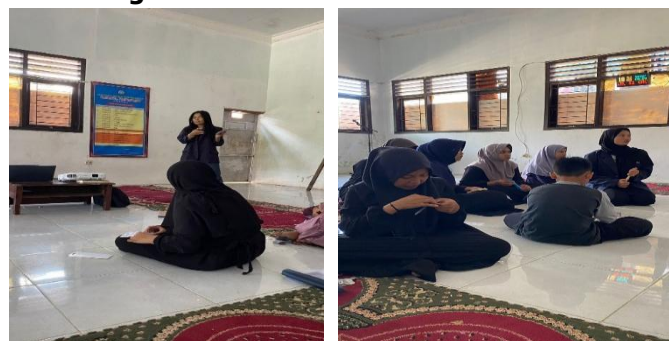
Gambar 2. Penjelasan Terkait Pemasaran Digital