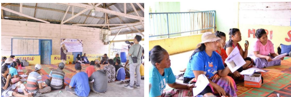
Gambar 1. Sosialisasi peningkatan pengetahuan pupuk organik cair kepada petani

Kegiatan sosialisasi dan pelatihan yang dilaksanakan pada 13 November 2025 diikuti oleh 35 anggota aktif Kelompok Tani Fajar Baru. Hasil evaluasi pengetahuan melalui pre-test dan post-test menunjukkan peningkatan yang signifikan. Skor rata-rata pre-test sebesar 42,3% meningkat menjadi 89,7% pada post-test, dengan 31 peserta (88,6%) mencapai skor di atas standar kompetensi minimal (75%). Peningkatan tertinggi terjadi pada pemahaman tentang proporsi bahan baku optimal dan teknik monitoring fermentasi, yang sebelumnya merupakan area pengetahuan yang paling rendah. Temuan ini sejalan dengan penelitian Chen et al. (11) yang menyebutkan bahwa pendekatan pelatihan partisipatif yang dilengkapi dengan materi visual dapat meningkatkan retensi pengetahuan petani hingga 85% dalam aspek teknik pertanian berkelanjutan. Partisipasi aktif dalam sesi praktik langsung menjadi faktor kunci keberhasilan, sebagaimana diungkapkan oleh Sari dan Pratama (12) bahwa pembelajaran kinestetik meningkatkan internalisasi pengetahuan teknis pada petani usia produktif.