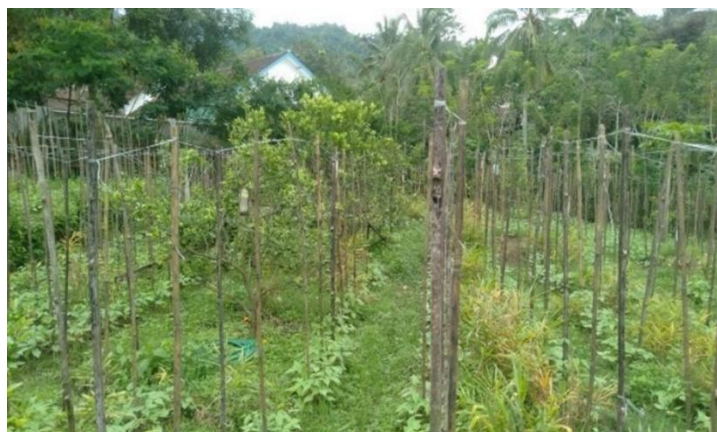
Gambar 4. Produk hasil implementasi Teknologi

Menurut penelitian terbaru oleh Wijaya et al. (2023), konversi limbah organik rumah tangga menjadi POC tidak hanya mengurangi beban TPA (Tempat Pembuangan Akhir) tetapi juga menciptakan siklus nutrisi tertutup ( closedloop nutrient cycling ) yang merupakan prinsip dasar pertanian sirkular. Kelompok Tani Fajar Baru telah menunjukkan potensi menjadi model pengelolaan limbah terpadu berbasis komunitas.