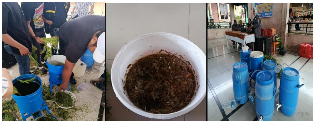
Gambar 3. Teknologi pembuatan Pupuk Organik Cair

Implementasi teknologi sederhana ini telah mengurangi biaya input pupuk sebesar Rp 175.000,- per hektar per musim tanam berdasarkan kalkulasi awal kelompok. Temuan ini konsisten dengan laporan FAO (14) yang menyebutkan bahwa adopsi teknologi pupuk organik skala kecil dapat mengurangi ketergantungan input kimia hingga 35% pada fase transisi pertama.