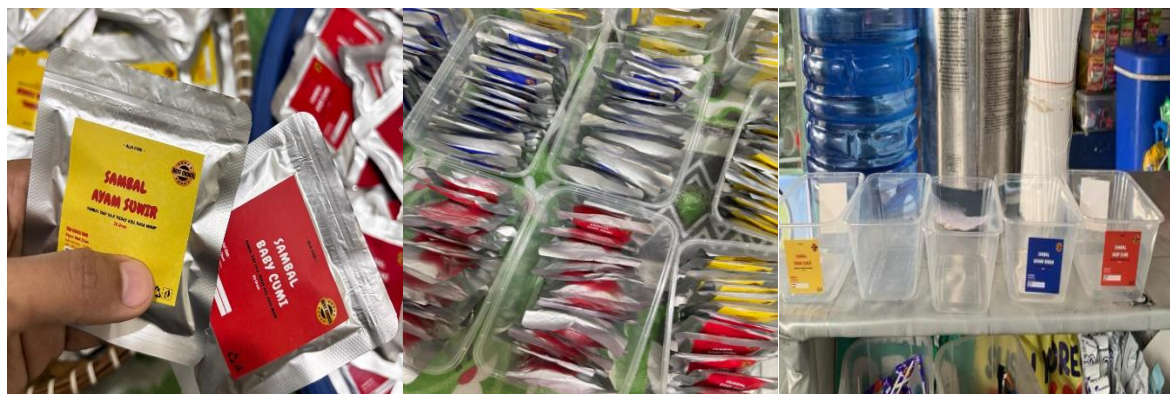
Gambar 1. Produk UMKM Sambal Ayam Suwir dan Baby Cumi

Hal ini relevan dengan salah satu UMKM pemula di Samarinda yang beralamat di Jalan Pangeran Suryanata Perum. Bukit Pinang Samarinda Kalimantan Timur bergerak dalam produksi sambal ayam suwir dan sambal baby cumi dalam kemasan sachet. Produk ini memiliki potensi pasar yang baik, terbukti dari penjualan 100 bungkus dalam dua hari di pasar sekolah. Namun, UMKM tersebut belum memiliki pencatatan keuangan yang memadai sehingga tidak mengetahui secara pasti besaran keuntungan dan kondisi keuangannya. Kondisi ini berpotensi menghambat perkembangan usaha, khususnya dalam akses pembiayaan dan perencanaan bisnis jangka panjang.