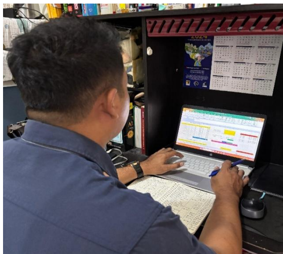
Gambar 4. Pelaku UMKM Mempraktekkan Penyusunan Laporan Keuangan Sederhana

Hasil evaluasi menunjukkan adanya peningkatan dalam pemahaman dan keterampilan pencatatan keuangan. Mitra yang sebelumnya hanya membuat catatan sederhana, kini mampu menyusun pencatatan transaksi sesuai prosedur akuntansi sederhana berbasis persamaan akuntansi, serta menghasilkan laporan laba rugi dan arus kas sederhana minimal untuk periode satu bulan.