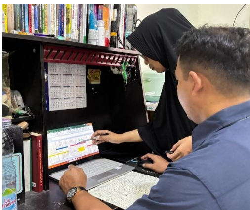
Gambar 3. Pendampingan Penyusunan Laporan Keuangan Sederhana

Pada tahap ini, partisipasi mitra sangat tinggi; mitra aktif bertanya, berdiskusi, dan mempraktikkan langsung pencatatan transaksi dari penjualan produk. Kegiatan ini tidak hanya meningkatkan keterampilan teknis, tetapi juga mendorong perubahan sikap mitra terhadap pentingnya pencatatan akuntansi dalam mengelola usaha.