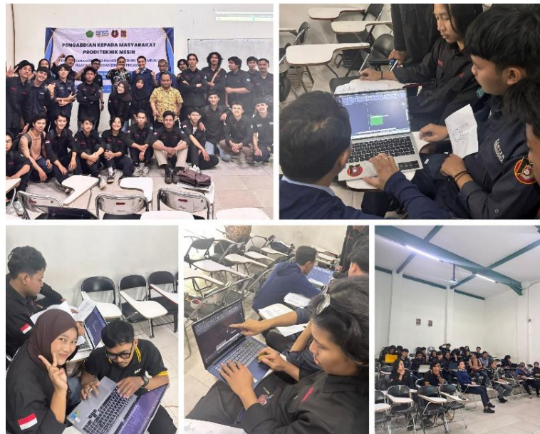
Gambar 2. Foto Kegiatan Pelatihan.

Kegiatan pelatihan autocad dilaksanakan dengan jumlah peserta 25 mahasiswa. Gambar project pelatihan difokuskan pada part mesin seperti bracket, poros, dan roda gigi dimulai dari tampak dan potongan dengan pemodelan 2D dan dilanjut model 3D. Pelaksanaan, kegiatan dilakukan secara langsung di kampus selama 1 (satu) hari. Pelatihan dilakukan berbasis praktik langsung karena lebih efektif untuk pembelajaran. Terlihat dari pelatihan, peserta sangat antusias dalam melaksanakan pelatihan. Hal tersebut dapat dilihat dari kehadiran peserta selama satu hari, seluruh peserta hadir selama kegiatan berlangsung. Pada pelatihan ini, para peserta juga sangat aktif berpartisipasi.