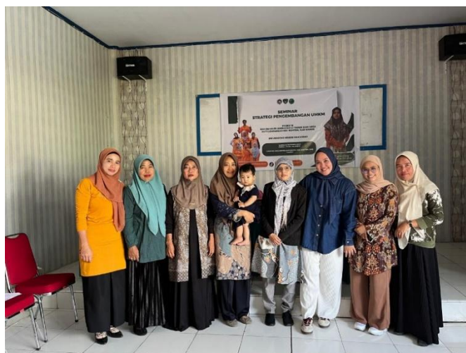
Gambar 4. Pendampingan bersama UMKM