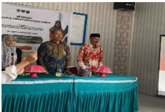
Gambar 2. Pembukaan Pelatihan