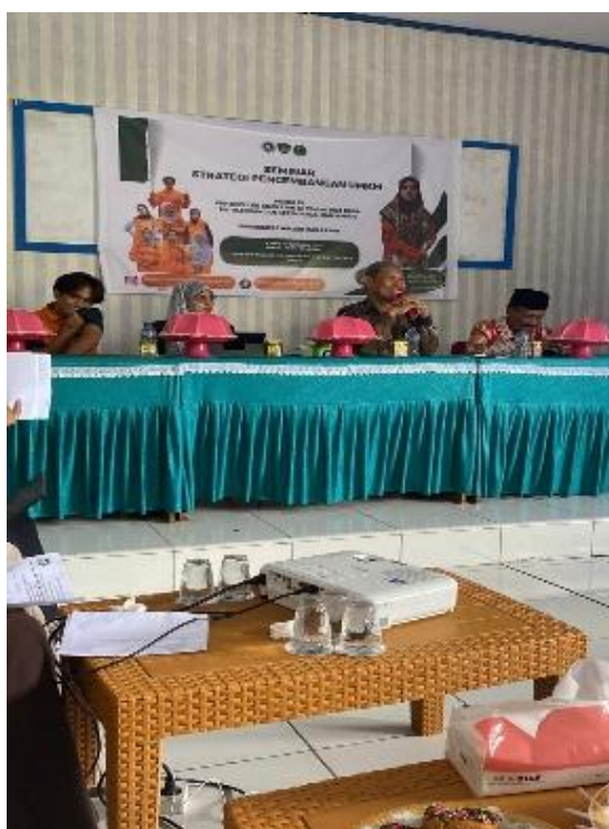
Gambar 3. Berlangsungnya Pelatihan