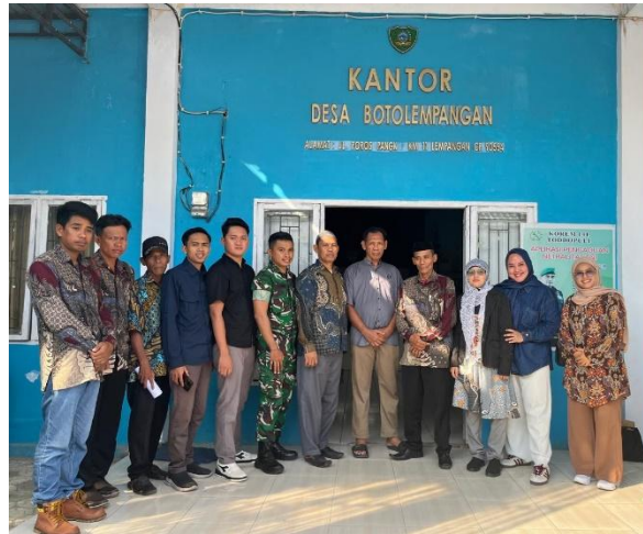
Gambar 5. Pendampingan bersama UMKM