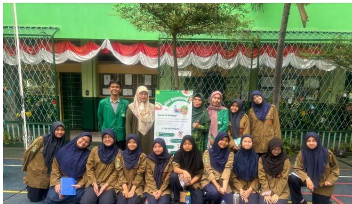
Gambar 6. Foto Bersama Tim Abdimas FIK Universitas Muhammadiyah Jakarta dengan Peer Edukator Remaja SMP Muhammadiyah 36 Jakarta Selatan

Selain itu, remaja juga menggunakan internet untuk mengembangkan diri, membentuk identitas, dan memperluas jaringan pertemanan. Sehingga media ini dapat digunakan sebagai salah satu upaya promotif dalam meningkatkan pengetahuan siswa mengenai kesehatan reproduksi (Tanjaya, 2025). . Pengetahuan adalah faktor utama yang mempengaruhi kesehatan reproduksi remaja. Pengetahuan juga merupakan salah satu faktor yang mempengaruhi perilaku seseorang (Suharti, S., & Surmiasih, S. 2016). Pengetahuan KRR dapat membantu meningkatkan harga diri, mengembangkan keterampilan komunikasi yang efektif dan mendorong kesadaran tentang pengetahuan terkait kesehatan dan penyakit (Mediastuti & Lestari, 2022).