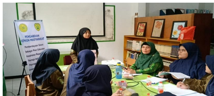
Gambar 5. Kegiatan Diskusi dengan Peer Educator