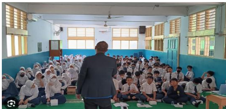
Gambar 2. Analisa situasi SMP Muhammadiyah 36 Jakarta Selatan