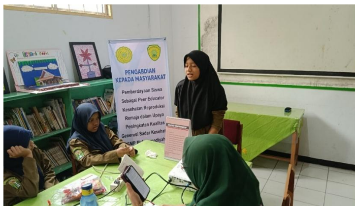
Gambar 4. Kegiatan Penyuluhan Kepada Peer Educator