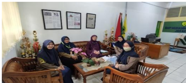
Gambar 1. Survey Analisa situasi dengan kepala sekolah