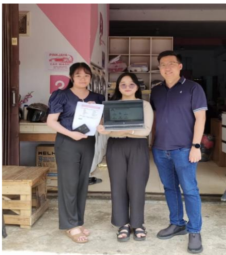
Gambar 2. Dokumentasi Pelaksanaan Kegiatan

Hasil evaluasi menunjukkan bahwa mitra telah mampu memanfaatkan sistem access yang dirancang secara mandiri untuk pencatatan transaksi usaha. Proses pencatatan yang sebelumnya dilakukan secara manual menjadi lebih tertata dan mudah ditelusuri, sehingga meningkatkan akurasi dan efisiensi dalam pemantauan arus kas, pendapatan, pengeluaran dan Kegiatan Operasional Nanik Ermawati, (2021)