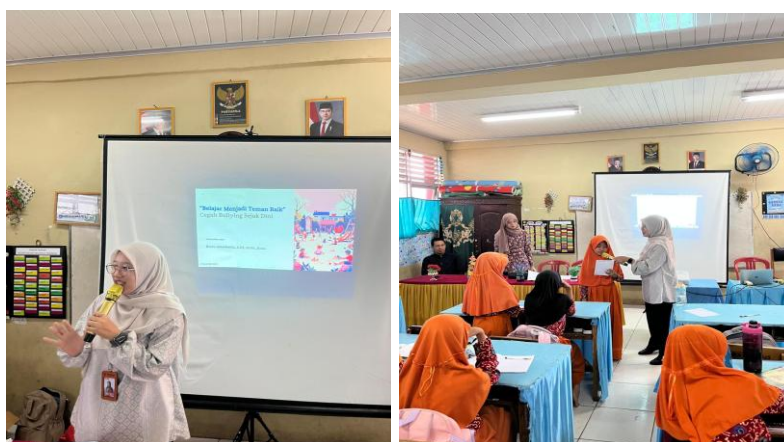
Gambar 2. Proses Pemaparan Materi Terhadap Siswa SDN 03 Kota Bengkulu

Pelaksanaan kegiatan pengabdian masyarakat di SDN 03 Kota Bengkulu menunjukkan ketercapaian target yang direncanakan. Selama kegiatan psikoedukasi dan sosialisasi berlangsung, siswa menunjukkan tingkat partisipasi aktif, baik dalam sesi pemaparan materi maupun diskusi interaktif. Respons positif ini menunjukkan bahwa pendekatan psikoedukatif yang digunakan sesuai dengan karakteristik perkembangan kognitif dan sosial anak usia sekolah dasar.