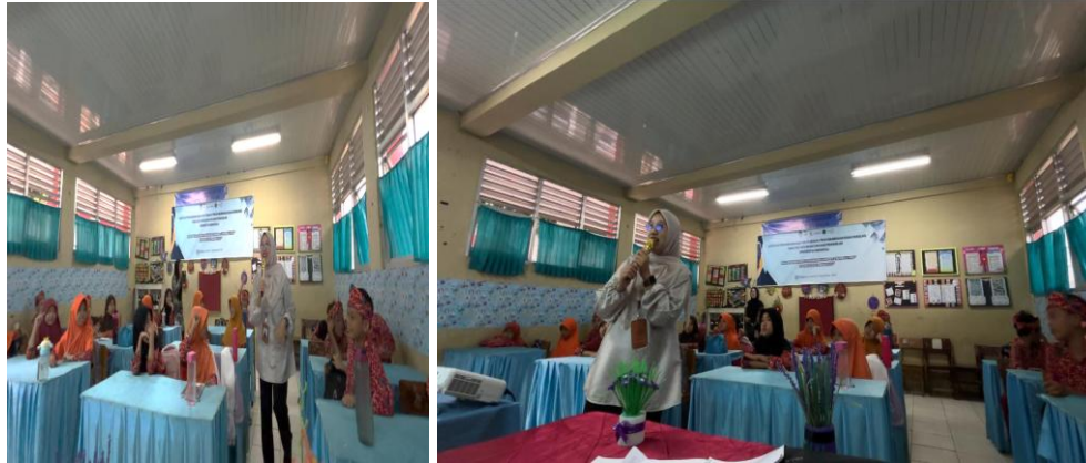
Gambar 3. Refleksi dan Evaluasi Kegiatan

Dari aspek perilaku, hasil observasi menunjukkan adanya kecenderungan siswa untuk mengekspresikan niat dan komitmen berperilaku lebih positif, seperti tidak mengejek teman, membantu teman yang mengalami kesulitan, serta melaporkan perilaku bullying kepada guru. Dalam konteks konseling preventif, perubahan pada level niat dan kesadaran perilaku ini merupakan indikator awal keberhasilan intervensi preventif, meskipun perubahan perilaku jangka panjang memerlukan pendampingan berkelanjutan.