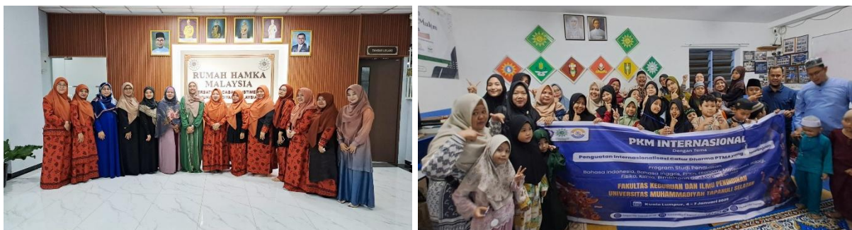
Gambar 3. Pelaksanaan Klinik Membaca dan Menulis di TPA Raudhatul Ilmi

Hasil pelaksanaan kegiatan menunjukkan bahwa pendekatan Klinik Membaca dan Menulis mampu menghadirkan proses pembelajaran literasi yang lebih personal, fleksibel, dan responsif terhadap kebutuhan peserta didik. Penerapan asesmen diagnostik pada tahap awal memungkinkan pendamping mengidentifikasi kesulitan spesifik siswa, sehingga intervensi yang diberikan menjadi lebih terarah dan efektif. Temuan ini sejalan dengan prinsip pembelajaran individual yang menegaskan pentingnya pemetaan kemampuan awal sebagai dasar dalam menentukan strategi pembelajaran yang tepat.