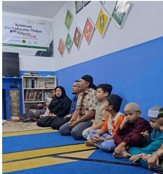
Gambar 2. Pelaksanaan Klinik Membaca dan Menulis di TPA Raudhatul Ilmi

Pelaksanaan Klinik Membaca dan Menulis dilaksanakan dalam kelompok kecil dengan menerapkan pendekatan yang suportif, partisipatif, dan interaktif. Pada tahap awal kegiatan, sebagian siswa menunjukkan sikap pasif dan cenderung menunggu instruksi dari pendamping. Namun demikian, setelah beberapa sesi berlangsung, terlihat perubahan dinamika pembelajaran menjadi lebih aktif, responsif, dan komunikatif.