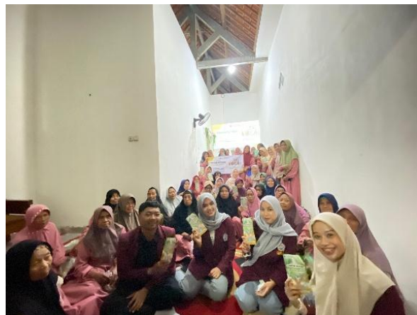
Gambar 3. Dokumentasi Kegiatan.