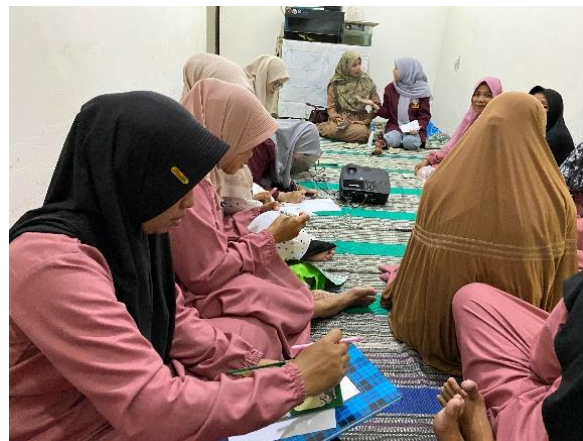
Gambar 2. Pengisian Pretest dan Post-test .

Pada kegiatan ini dilakukan pretest sebelum pemaparan materi dan post-test untuk menilai perubahan pengetahuan peserta sesudah narasumber menyampaikan materi. Pertanyaan yang diberikan kepada peserta berupa pernyataan yang harus dinilai kebenarannya. Tingkat pengetahuan responden pada penelitian ini dinilai berdasarkan hasil jawaban responden dalam kuesioner mengenai pengetahuan dalam pemilihan kosmetik halal dan aman sebanyak 10 butir pernyataan dengan pilihan jawaban benar dan salah.