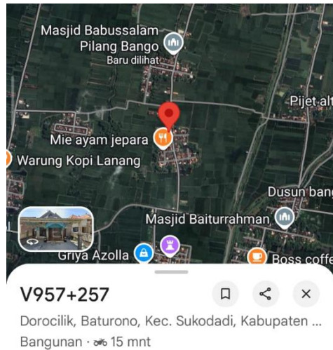
Gambar 1. Lokasi Kegiatan.

Pada kegiatan ini dilakukan pretest sebelum pemaparan materi dan post-test untuk menilai perubahan pengetahuan peserta sesudah narasumber menyampaikan materi. Pertanyaan yang diberikan kepada peserta berupa pernyataan yang harus dinilai kebenarannya. Tingkat pengetahuan responden pada penelitian ini dinilai berdasarkan hasil jawaban responden dalam kuesioner mengenai pengetahuan dalam pemilihan kosmetik halal dan aman sebanyak 10 butir pernyataan dengan pilihan jawaban benar dan salah.