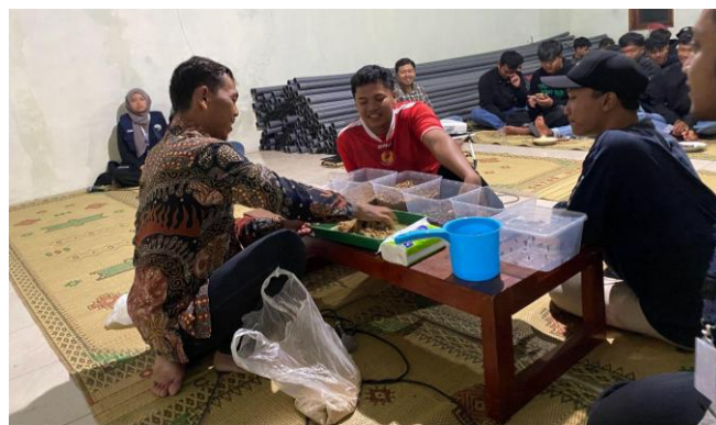
Gambar 2. Demonstrasi Teknik Budidaya Maggot

Tahap budidaya maggot diawali dengan persiapan wadah atau tempat budidaya. Wadah yang digunakan harus bersih dan memiliki sistem aerasi yang baik sehingga kondisi media pakan tetap stabil dan terjaga. Media pakan berasal dari limbah organik rumah tangga yang dicacah sehingga mudah dikonsumsi maggot. Media pakan dijaga pada kondisi lembab dengan suhu optimal sekitar 27–30°C untuk mendukung penetasan telur dan pertumbuhan maggot. Larva BSF diberi pakan secara bertahap sesuai kebutuhan pertumbuhan untuk menghindari pembusukan media. Pemeliharaan dilakukan dengan menjaga kelembapan, mengontrol bau, serta memastikan media tidak terlalu basah. Larva dipanen pada umur sekitar 14–21 hari saat ukuran optimal dan kandungan nutrisinya tinggi. Teknik budidaya tersebut sesuai dengan penelitian yang menyatakan bahwa larva BSF mampu mengkonversi limbah organik secara efisien apabila didukung kondisi lingkungan dan manajemen pakan yang tepat. Penelitian oleh Lalander et al. (2019), menjelaskan bahwa efisiensi biokonversi larva BSF dipengaruhi oleh jenis dan kualitas substrat organik yang digunakan. Studi oleh Barragan-Fonseca et al. (2017), menunjukkan bahwa pertumbuhan dan komposisi nutrisi larva dipengaruhi oleh manajemen pakan dan kondisi lingkungan pemeliharaan. Penelitian oleh Gold et al. (2018), menegaskan bahwa budidaya BSF berpotensi menjadi solusi pengolahan limbah organik sekaligus menghasilkan sumber protein alternatif yang berkelanjutan.