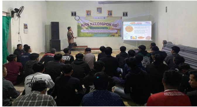
Gambar 1. Pemaparan Materi Budidaya Maggot

Tahap budidaya maggot diawali dengan persiapan wadah atau tempat budidaya. Wadah yang digunakan harus bersih dan memiliki sistem aerasi yang baik sehingga kondisi media pakan tetap stabil dan terjaga. Media pakan berasal dari limbah organik rumah tangga yang dicacah sehingga mudah dikonsumsi maggot. Media pakan dijaga pada kondisi lembab dengan suhu optimal sekitar 27–30°C untuk mendukung penetasan telur dan pertumbuhan maggot. Larva BSF diberi pakan secara bertahap sesuai kebutuhan pertumbuhan untuk menghindari pembusukan media. Pemeliharaan dilakukan dengan menjaga kelembapan, mengontrol bau, serta memastikan media tidak terlalu basah. Larva dipanen pada umur sekitar 14–21 hari saat ukuran optimal dan kandungan nutrisinya tinggi. Teknik budidaya tersebut sesuai dengan penelitian yang menyatakan bahwa larva BSF mampu mengkonversi limbah organik secara efisien apabila didukung kondisi lingkungan dan manajemen pakan yang tepat. Penelitian oleh Lalander et al. (2019), menjelaskan bahwa efisiensi biokonversi larva BSF dipengaruhi oleh jenis dan kualitas substrat organik yang digunakan. Studi oleh Barragan-Fonseca et al. (2017), menunjukkan bahwa pertumbuhan dan komposisi nutrisi larva dipengaruhi oleh manajemen pakan dan kondisi lingkungan pemeliharaan. Penelitian oleh Gold et al. (2018), menegaskan bahwa budidaya BSF berpotensi menjadi solusi pengolahan limbah organik sekaligus menghasilkan sumber protein alternatif yang berkelanjutan.