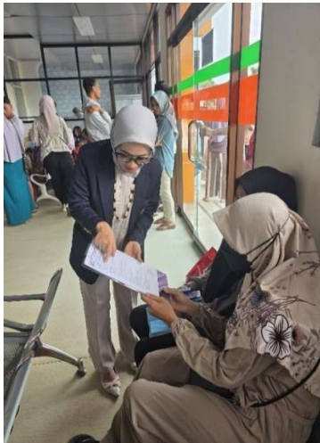
Gambar 4. Pengisian pre-test dan post-test peserta