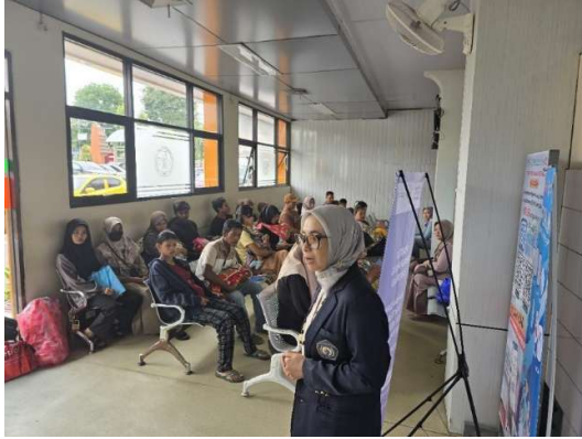
Gambar 2. Implementasi kegiatan Pengabdian Masyarakat di RSUD Kabupaten Kediri