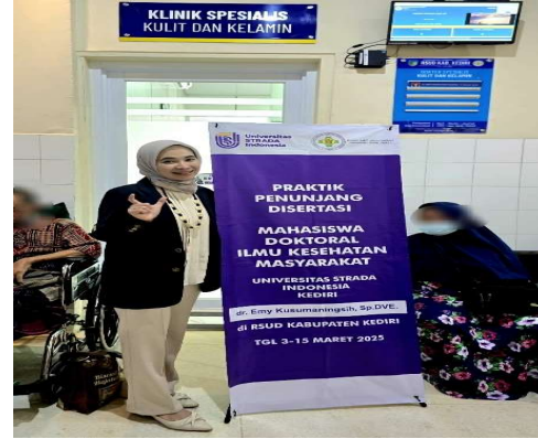
Gambar 3. Penyuluhan kepada peserta