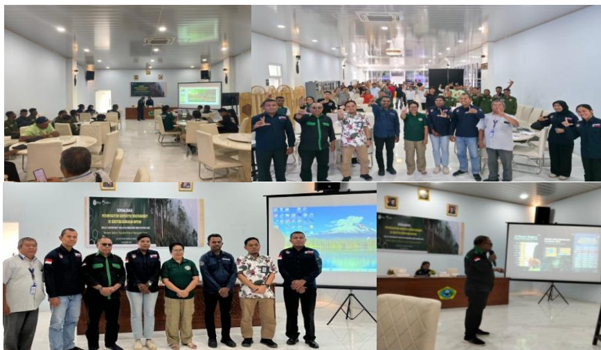
Gambar 1. Kegiatan Sosialisasi Pemberdayaan Masyarakat & Gakkum

Dalam konteks Maluku dan Papua, yang memiliki karakteristik sosial budaya dan kearifan lokal yang kuat, pendekatan dialogis dan persuasif menjadi sangat relevan. Keterlibatan tokoh adat dan masyarakat lokal dalam kegiatan sosialisasi memperkuat legitimasi pesan hukum yang disampaikan dan meningkatkan tingkat penerimaan masyarakat. Hasil identifikasi permasalahan dan potensi kerawanan pelanggaran memberikan gambaran bahwa tekanan ekonomi dan keterbatasan alternatif mata pencaharian masih menjadi tantangan utama. Oleh karena itu, kegiatan sosialisasi perlu dilanjutkan dengan program pendampingan lintas sektor yang melibatkan instansi terkait, guna mendorong pemanfaatan sumber daya hutan secara legal dan berkelanjutan.