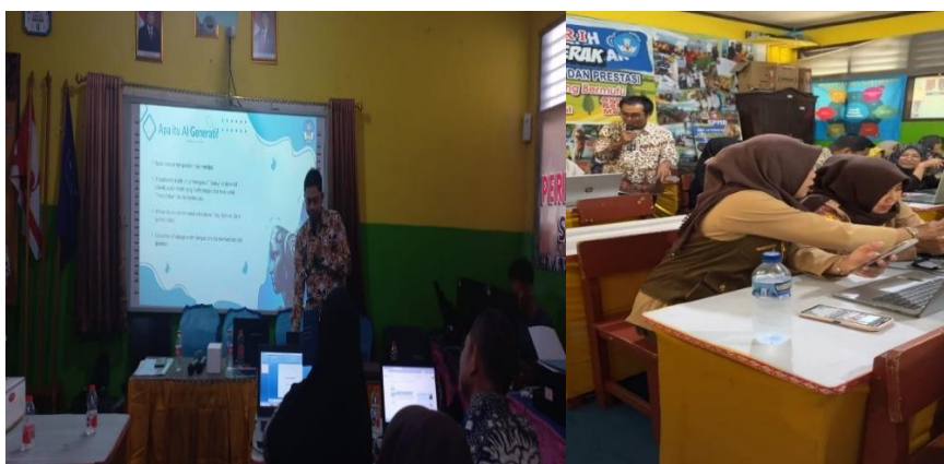
Gambar 2. Aktivitas Pendampingan Praktik Mandiri Pemanfaatan AI oleh Guru

Transformasi kemampuan guru di SDN Jatimekar I Bekasi teramati secara signifikan melalui observasi langsung dan evaluasi hasil praktik. Sebelum program dimulai, pemahaman peserta terhadap AI masih bersifat general. Namun, pasca pelatihan, guru mampu mendemonstrasikan kecakapan dalam menyusun instruksi teks atau prompting yang presisi. Sebagaimana ditunjukkan pada gambar 2, setiap tenaga pendidik berinteraksi langsung dengan perangkat digital untuk mengeksplorasi antarmuka platform Generative AI . Pada fase ini, tim pengabdian memberikan asistensi personal guna memastikan guru memahami alur navigasi dasar sebelum masuk ke tahap instruksi yang lebih kompleks.