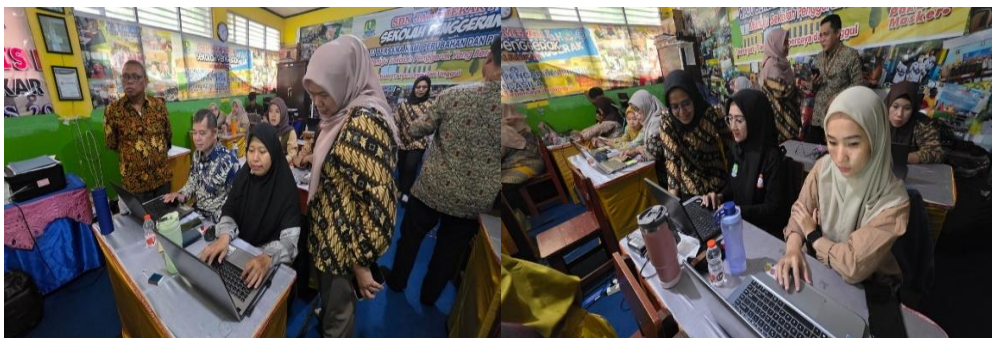
Gambar 1. Dokumentasi Interaksi Guru Selama Pelatihan

Keberhasilan awal program ini ditandai dengan tingginya antusiasme tenaga pendidik di SDN Jatimekar I Bekasi. Sebagaimana terdokumentasi dalam gambar 1, keterlibatan aktif peserta terlihat mulai dari sesi pemaparan konsep hingga diskusi reflektif. Partisipasi guru dikategorikan sangat baik yang dibuktikan melalui kehadiran yang konsisten serta interaksi dua arah yang intens dalam sesi tanya jawab. Hal ini menunjukkan bahwa materi pelatihan mengenai kecerdasan buatan (AI) merupakan kebutuhan aktual yang sangat dinantikan oleh para guru untuk menjawab tantangan administrasi pembelajaran di era modern.