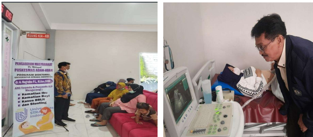
Gambar 2. Pelaksanaan Kegiatan Pengabdian

Edukasi dan penyuluhan melalui media non digital berupa leaflet, banner, poster yang berisi informasi ANC terpadu dan pentingnya kunjungan trimester pertama(K1). Sedangkan yang melalui media digital menggunakan Google Form, dimana Ibu hamil secara langsung mengisi pertanyaan – pertanyaan dalam google form tentang informasi kesehatan Ibu hamil yang bersangkutan. Hal ini merupakan inovasi dari pengabdian masyarakat ini.