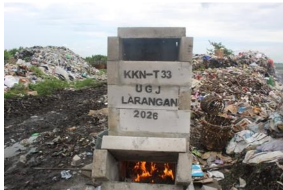
Gambar 3. Uji coba pembakaran sampah menggunakan insinerator di Desa Larangan yang menunjukkan emisi asap sekitar 70-80% dalam waktu singkat

jauh lebih efisien dengan kemampuan reduksi volume mencapai 80% dalam waktu yang relatif singkat dibandingkan metode konvensional. Keberhasilan program ini pun mendapat respon yang sangat positif dari masyarakat dan perangkat desa, mengingat kehadiran tim KKN-T telah berhasil memberikan solusi teknis yang konkret atas permasalahan lingkungan yang telah menahun.