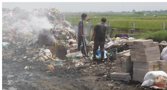
Gambar 1. Praktik open burning pada penumpukan sampah di TPS Desa Larangan yang berkontribusi terhadap peningkatan pencemaran udara di lingkungan sekitar

Ciri khas asap yang dihasilkan dari pembakaran sampah rumah tangga yang bercampur dengan material plastik menghasilkan partikel tebal yang menyebar secara horizontal mengikuti arah angin ke jalan raya. Dampak paling mendesak dari fenomena ini adalah penurunan jarak pandang bagi pengguna jalan yang melintas, yang secara empiris telah menjadi faktor penentu dalam insiden kecelakaan lalu lintas di wilayah tersebut. Secara teoritis, pembakaran terbuka tidak hanya melepaskan karbon monoksida tetapi juga dioksin dan furan yang bersifat karsinogenik, sehingga keberadaan TPS ini di samping gedung Satuan Pelayanan Pemenuhan Gizi (SPPG) menjadi ancaman serius terhadap standar sanitasi dan kebersihan pangan bagi masyarakat rentan.