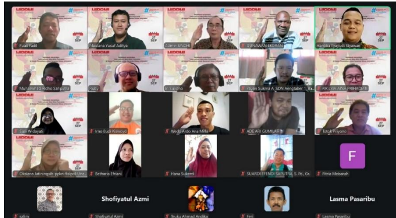
Gambar 2. Dokumentasi Narasumber & Peserta

tidak sekadar pelengkap acara, tetapi merupakan komponen esensial dalam proses pengabdian kepada masyarakat yang berorientasi pada transformasi pengetahuan, sikap, dan tindakan sosial.