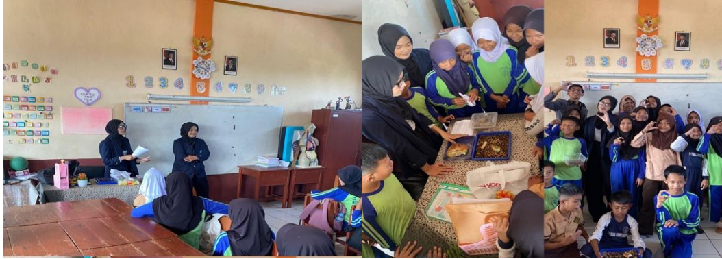
Gambar 2. Pelaksanaan pengabdian