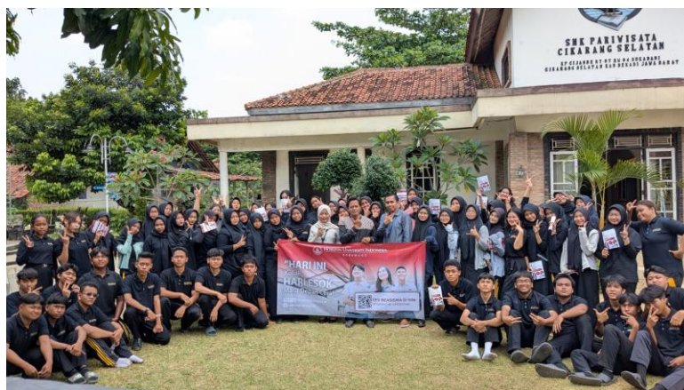
Gambar 2. Dokumentasi Kegiatan Edukasi Peluang Karier dan Studi Lanjutan di SMK Pariwisata Cikarang Selatan