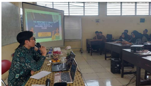
Gambar 1. Kegiatan Sosialisai dan Penyampaian Materi

Adapun tujuan dari kegiatan pengabdian kepada masyarakat ini adalah mendorong dan memberikan wawasan serta pengetahuan yang luas mengenai pentingnya belajar bahasa Inggris bagi siswa MA yang ada di pondok pesantren "Jamiyatul Falah", Bogor. Metode yang dilakukan untuk melakukan hal tersebut adalah dengan sosialisasi yaitu dengan ceramah serta memberikan respon secara langsung ketika ada siswa yang bertanya mengenai materi yang kurang bisa dipahami. (Gambar 1) menunjukkan bahwa fasilitator sedang menjelaskan materi secara langsung kepada siswa MA "Jamiyatul Falah".