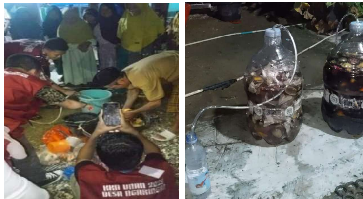
Gambar 4. Demonstrasi Pembuatan Eco Enzyme

Namun demikian, kegiatan sosialisasi ini juga mengungkapkan beberapa tantangan yang masih perlu diatasi. Beberapa peserta merasa kurang percaya diri dalam melakukan fermentasi secara mandiri karena khawatir gagal atau menghasilkan Eco Enzyme yang tidak sesuai. Hal ini menunjukkan masih adanya keterbatasan dalam pemahaman teknis, terutama dalam hal takaran bahan, durasi fermentasi, serta kondisi penyimpanan (Handayani & Prasetyo, 2021). Selain itu, sebagian masyarakat masih memerlukan penjelasan lebih lanjut mengenai manfaat jangka panjang dari penggunaan Eco Enzyme , baik dari sisi ekonomis, ekologis, maupun kesehatan (Yuniarti & Harahap, 2022).