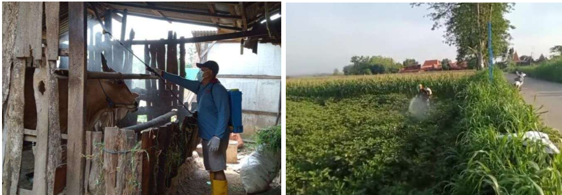
Gambar 5. Pemanfaatan Eco Enzyme

(Kusumawati & Yuliana, 2022). Dengan adanya upaya perbaikan tersebut, diharapkan program sosialisasi Eco Enzyme dapat memberikan hasil yang lebih optimal dan memastikan masyarakat dapat memanfaatkan Eco Enzyme secara lebih luas dan mandiri (Handayani & Prasetyo, 2021).