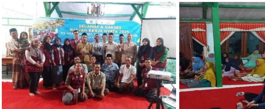
Gambar 2. Pelaksanaan Kegiatan

Kegiatan sosialisasi Eco Enzyme yang dilakukan di Desa Ngaringan memberikan dampak positif yang nyata dalam meningkatkan pemahaman dan kesadaran masyarakat terhadap pentingnya pengelolaan limbah organik rumah tangga (Handayani & Prasetyo, 2021; Kusumawati & Yuliana, 2022). Melalui pendekatan partisipatif berupa ceramah, diskusi interaktif, serta praktik langsung, masyarakat yang terdiri dari ibu rumah tangga, petani, dan peternak mulai memahami konsep dasar, manfaat, serta teknik pembuatan Eco Enzyme . Peserta kegiatan menunjukkan antusiasme yang tinggi selama proses berlangsung dan aktif mengajukan pertanyaan seputar penerapan Eco Enzyme dalam kehidupan sehari-hari (Sari & Wulandari, 2020).