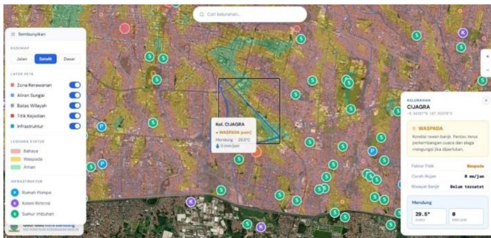
Gambar 2. Panel Informasi Status Risiko Kelurahan Cijagra

Tampilan utama WebGIS ini dibuat dengan menggunakan Leaflet.js, menyajikan peta dasar yang saling bertumpuk ( overlay ) dengan layer batas administrasi, lalu infrastruktur tata air yang dapat dilihat dari sebaran penanda ( marker ), serta legenda dinamis pada sudut peta. Tingkat interaktivitas sistem WebGIS ini semakin user friendly yang bisa dilihat pada gambar 2, ketika user mengklik atau mencari suatu kelurahan, sebuah popup panel di kanan bawah akan muncul yang berisikan rincian informasi hasil komputasi risiko dari rumus yang sudah di masukan ke dalam code .