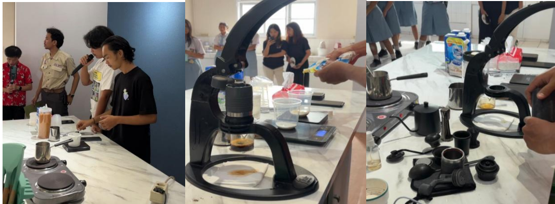
Gambar 3. Demonstrasi Langsung

Melalui kegiatan ini, peserta tidak hanya memperoleh pemahaman teoritis mengenai konsep akuntansi manajemen, tetapi juga mampu menghubungkan teori tersebut dengan praktik usaha sehari-hari. Pendekatan demonstrasi langsung dinilai efektif karena mampu membantu peserta memahami proses perhitungan biaya secara lebih aplikatif dan mudah dipahami. Selain itu, metode ini juga mendorong keterlibatan aktif peserta dalam proses pembelajaran sehingga transfer pengetahuan dapat berlangsung secara lebih optimal dan relevan dengan kondisi usaha yang dijalankan (Fitria et al., 2022).