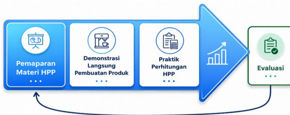
Gambar 1. Alur Pelaksanaan PKM