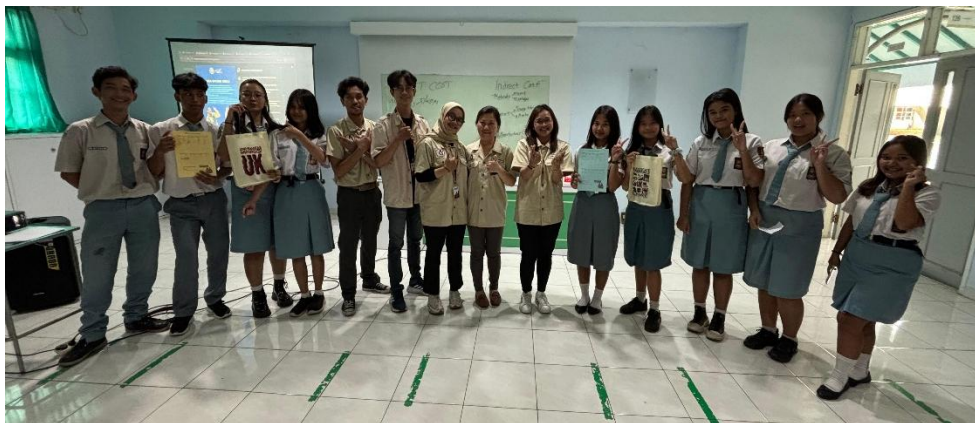
Gambar 5. Pembagian Reward

Tahap akhir kegiatan dilakukan melalui evaluasi hasil perhitungan HPP yang telah disusun oleh masing-masing kelompok. Dosen yang bertugas mengoreksi dan membandingkan hasil perhitungan peserta dengan nilai HPP aktual yang telah disiapkan sebelumnya. Kelompok dengan hasil perhitungan yang paling mendekati nilai sebenarnya ditetapkan sebagai pemenang dan diberikan reward berupa hadiah. Berikut dokumentasi kelompok pemenang dengan hasil perhitungan yang benar .