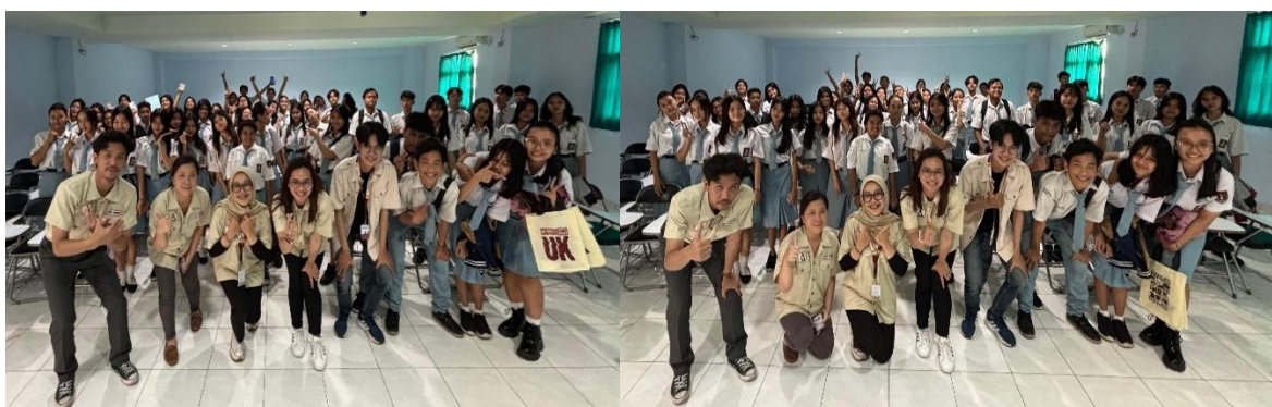
Gambar 6. Evaluasi dan Penutupan

Berdasarkan hasil evaluasi, mayoritas peserta telah memahami konsep dasar penyusunan HPP dengan lebih baik dibandingkan sebelum kegiatan berlangsung. Hal tersebut terlihat dari kemampuan peserta dalam mengidentifikasi komponen biaya produksi serta menyusun perhitungan biaya secara lebih sistematis (Yuliansah, 2019). Selain itu, peserta juga memberikan respons positif terhadap metode pembelajaran yang diterapkan karena dinilai lebih interaktif, aplikatif, dan mudah dipahami. Kegiatan evaluasi tidak hanya berfungsi untuk mengukur tingkat pemahaman peserta, tetapi juga menjadi sarana refleksi bagi pemateri dalam menilai efektivitas metode pembelajaran yang digunakan (Setiawan, 2022). Dengan adanya evaluasi secara langsung, peserta dapat mengetahui kesalahan dalam proses perhitungan dan memahami langkah perbaikan yang perlu dilakukan. Secara keseluruhan, kegiatan PkM ini berhasil meningkatkan pemahaman siswa mengenai implementasi akuntansi manajemen dalam penentuan Harga Pokok Produksi (HPP) pada usaha minuman kopi. Integrasi antara praktik industri dan pembelajaran akuntansi memberikan pengalaman belajar yang aplikatif serta mendukung penguatan kompetensi kewirausahaan siswa SMK (Wijaya et al., 2020). Berikut dokumentasi pelaksanaan PkM kepada seluruh dosen dan peserta.