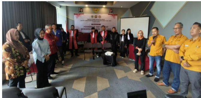
Gambar 5. Arahan dari Yayasan Lembaga Bantuan Hukum Kabupaten Gresik bersinergi dengan dosen-dosen pendamping dari Fakultas Hukum Universitas Gresik

Sinergi antara akademisi dan lembaga bantuan hukum ini menjadi model kolaborasi yang efektif dalam kegiatan pengabdian kepada masyarakat. Akademisi memberikan landasan teoritis, sementara lembaga bantuan hukum memberikan perspektif praktis yang kontekstual.