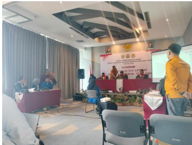
Gambar 3. Praktik Simulasi Peradilan Perdata