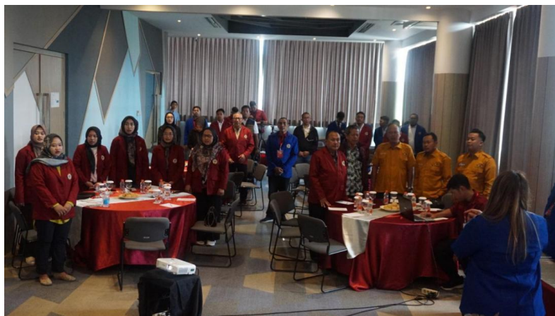
Gambar 1. Pembukaan Acara