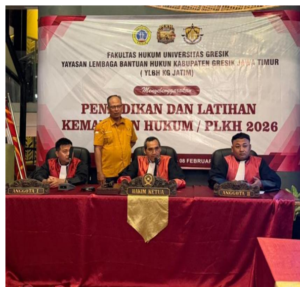
Gambar 4. Peningkatan pemahaman peran hakim dalam perkara perdata