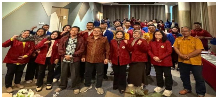
Gambar 6. Keterlibatan seluruh peserta