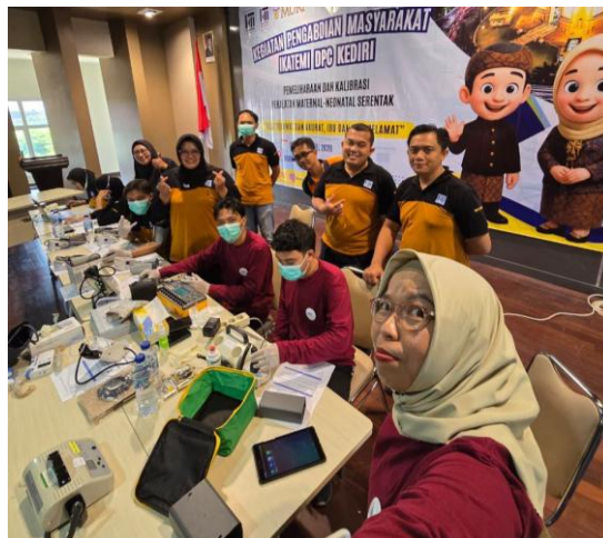
Gambar 2. Pelaksanaan kegiatan pemeliharaan alat kesehatan di RSUD SLG Kediri

Kegiatan pengelolaan teknis peralatan maternal-neonatal dilakukan melalui tahapan identifikasi alat, pemeriksaan kondisi fisik, pengecekan fungsi, pemeliharaan atau perbaikan ringan, serta penentuan status kelaikan alat. Fokus kegiatan ini selaras dengan peran elektromedis dalam memastikan peralatan kesehatan tidak hanya tersedia, tetapi juga aman, akurat, andal, terdokumentasi, dan siap digunakan dalam pelayanan kesehatan ibu dan bayi. Dokumentasi kegiatan pengabdian kepada masyarakat disajikan pada Gambar 2 dan Gambar 3.