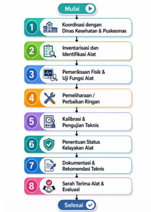
Gambar 1. Tahapan pelaksanaan

Kegiatan pengabdian kepada masyarakat ini menggunakan metode deskriptif kualitatif untuk menggambarkan proses pengelolaan teknis peralatan maternal-neonatal oleh tenaga elektromedis. Kegiatan dilaksanakan pada bulan April 2026 di Aula RSUD SLG Kediri dengan melibatkan delapan puskesmas wilayah Kota Kediri yang memiliki layanan maternal-neonatal. Penentuan status kelayakan alat mengacu pada hasil pemeriksaan fungsi, kondisi fisik, dan kesesuaian parameter alat terhadap batas toleransi pengujian sesuai standar kalibrasi alat kesehatan. Kegiatan pengabdian kepada masyarakat ini melibatkan 6 orang dosen dan 3 orang mahasiswa program studi D3 Teknologi Elektromedis Universitas Kediri, serta 29 orang dari pihak IKATEMI DPC Kediri. Alur pelaksanaan kegiatan dapat dilihat pada Gambar 1 di bawah ini.