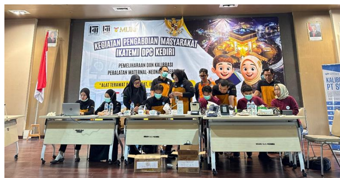
Gambar 3. Foto bersama peserta kegiatan pemeliharaan alat kesehatan di RSUD SLG Kediri