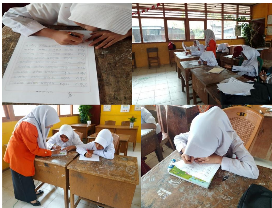
Gambar 2. Murid Mulai Menulis Kalimat Sederhana pada Lembar Kertas Halus Kasar

Namun, setelah diterapkannya pembelajaran menggunakan teknik pemodelan berbantuan video modeling , hasil tulisan murid mengalami peningkatan. Tulisan murid menjadi lebih rapi, ukuran huruf lebih teratur, dan kalimat yang ditulis lebih mudah dibaca. Murid juga mulai mampu menggunakan huruf kapital pada awal kalimat dan memahami penggunaan spasi antar kata dengan lebih baik.