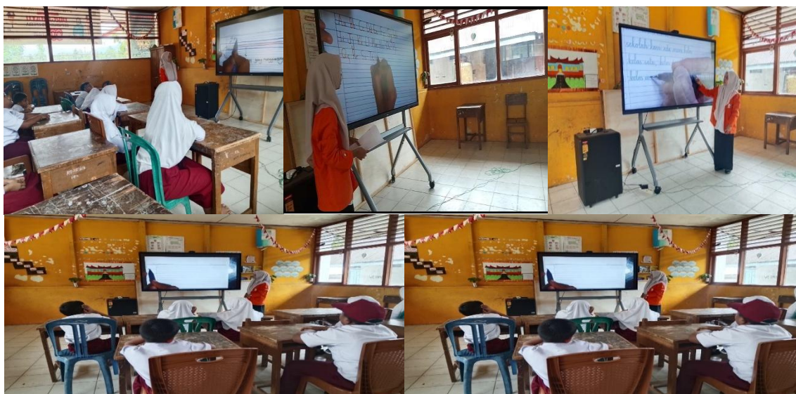
Gambar 1. Guru Menayangkan Video Modeling pada Tahap Awal Pembelajaran Menulis Permulaan kepada Murid

Setelah guru menayangkan video modeling , murid mulai melakukan kegiatan latihan menulis menggunakan lembar buku halus kasar. Pada tahap ini, murid diminta untuk menyalin huruf dan kata sederhana yang telah dicontohkan pada video. Penggunaan buku halus kasar membantu murid dalam mengontrol ukuran huruf, menjaga kerapian tulisan, serta melatih koordinasi motorik halus pada saat menulis. Keterampilan menulis yang baik dihasilkan jika seorang anak telah memiliki keterampilan motorik halus tangan dan keterampilan persepsi visual yang baik (Rahmi & Damri, 2021).