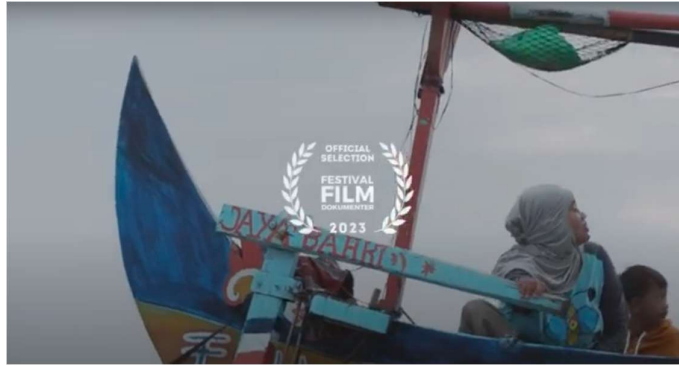
Gambar 1. Adegan Pembuka Film Mother of the Sea