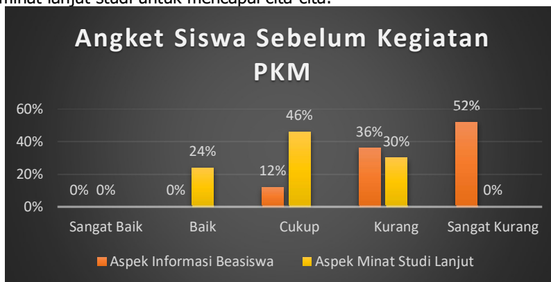
Gambar 4. Persentase Hasil Angket sebelum kegiatan PKM

Tahap evaluasi dilakukan dengan menganalisis hasil angket respon siswa yang telah dibagikan di awal dan di akhir kegiatan untuk melihat dampak acara sosialisasi beasiswa yang dilaksanakan. Angket respon siswa terdiri dari 10 soal yang mencakup dua aspek yang berkaitan dengan informasi beasiswa dan minat lanjut studi untuk mencapai cita-cita.