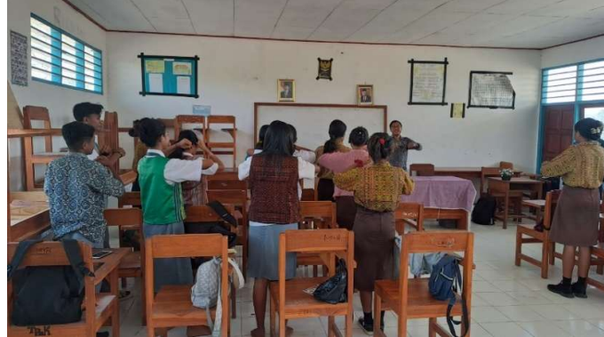
Gambar 3. Kegiatan Ice Breaking

Selanjutnya pemateri menyampaikan materi tentang Beasiswa Perintis. Beasiswa Perintis adalah program bantuan bimbingan persiapan bagi siswa yang berkeinginan melanjutkan studi ke Perguruan Tinggi Negeri (PTN) terkemuka di Indonesia, dan diperuntukkan bagi siswa kelas 12 SMA atau yang sederajat dari seluruh wilayah Indonesia. Benefit yang dapat diperoleh mulai dari bimbingan intensif persiapan UTBK, kegiatan pengembangan diri, pelatihan, training motivasi, dan tes bakat, relasi dengan peserta se-Indonesia, hingga bantuan biaya kuliah dan biaya hidup selama 4 tahun.