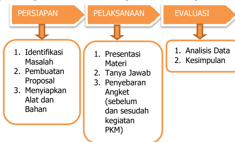
Gambar 1. Tahapan Alur Pengabdian Masyarakat

yang dilakukan dalam melaksanakan solusi yang akan ditawarkan adalah melalui tiga tahapan. Terdiri dari tahap persiapan, tahap pelaksanaan, dan terakhir adalah tahap evaluasi. Pada tahap persiapan, dimulai dari menganalisis situasi dan permasalahan yang dihadapi siswa. Pada tahap ini ditemukan bahwa sebagian besar siswa kelas 12 mengalami kebingungan atau belum menemukan tujuan untuk melanjutkan studi (Amrulloh et.al., 2024) serta mereka belum mengetahui informasi tentang beasiswa yang bisa membantu mereka untuk melanjutkan ke perguruan tinggi. Dari identifikasi masalah di atas maka dilanjutkan pembuatan proposal pengabdian, serta menyiapkan alat dan bahan yang diperlukan untuk melaksanakan pengabdian di sekolah tersebut. Pada tahap pelaksanaan, tim pengabdian secara langsung memberikan materi sosialisasi pentingnya pendidikan tinggi, jalur masuk perguruan tinggi serta program beasiswa apa saja yang dapat mereka daftar. Setelah selesai pemaparan materi dilanjutkan tanya jawab terkait materi yang sudah dipaparkan dan kemudian penyebaran angket untuk melihat apakah pelaksanaan pengabdian memberikan manfaat bagi siswa. Untuk tahap terakhir yaitu tahap evaluasi yaitu menganalisis data dari hasil angket kemudian mengambil kesimpulan.