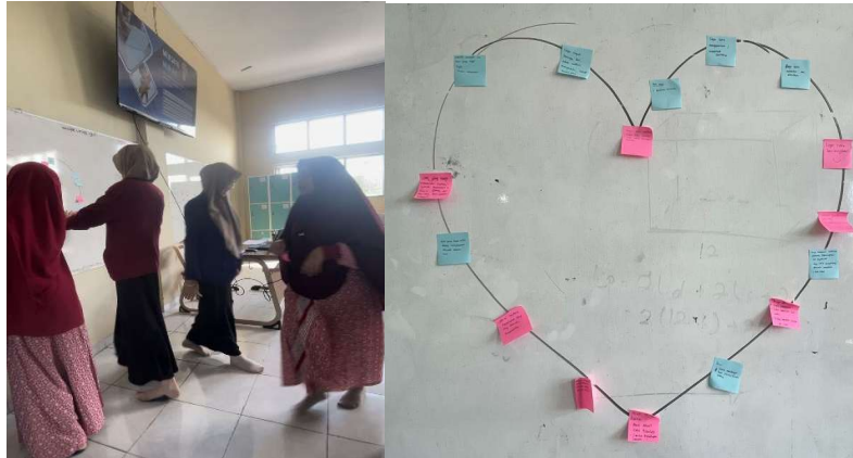
Gambar 4. Kegiatan menggali aset atau modal guru

(Kurniawan & Yusuf, 2022). Sejalan dengan pendapat yang disampaikan oleh Fauzi dan Lestari (2021) menyatakan bahwa pendampingan menulis mampu memperkuat kompetensi guru.