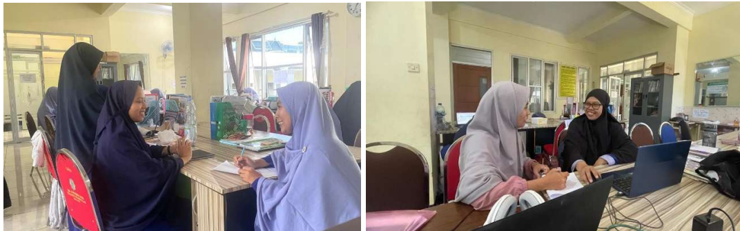
Gambar 1. Analisis kebutuhan dan permasalahan menulis guru

Analisis kebutuhan dan permasalahan guru dalam menulis dilakukan dengan tujuan untuk memahami sejauh mana kompetensi guru dalam keterampilan menulis, serta mengidentifikasi permasalahan atau hambatan yang dihadapi ketika menulis. Sejalan dengan pendapat yang disampaikan oleh Maritim (2022) menunjukkan bahwa kebutuhan dalam pelatihan menulis untuk meningkatkan motivasi guru dalam menghasilkan karya. Beberapa permasalahan yang dialami oleh guru yakni jadwal mengajar yang padat, beban administrasi yang menumpuk, serta berbagai kegiatan sekolah lainnya seringkali menyisakan sedikit waktu dan energi bagi guru untuk terlibat dalam kegiatan menulis kreatif secara mendalam dan berkualitas.