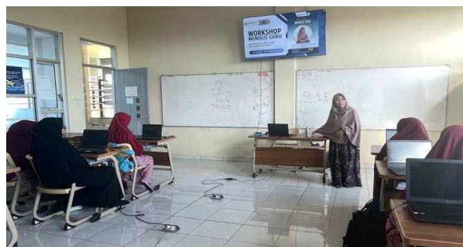
Gambar 3. Kegiatan workshop menulis guru

Workshop menulis guru yang diterapkan dalam kegiatan ini bersifat partisipatif dan reflektif, sehingga peserta tidak hanya memahami konsep dasar menulis tetapi peserta diajak menulis langsung serta memahami proses kreatif penulisan cerita pendek. Hal tersebut senada dengan pendapat yang disampaikan oleh Asrifan, dkk. (2021) bahwa guru abad 21 harus menguasai literasi dasar dan kreatif, salah satunya kemampuan menulis naratif yang relevan dengan konteks sosial budaya peserta didik. Aktivitas menulis dapat membantu guru merefleksikan praktik mengajar, mengidentifikasi kekuatan dan kelemahan, serta best practice dalam pembelajaran di kelas (Rahmah & Ridwan, 2021).