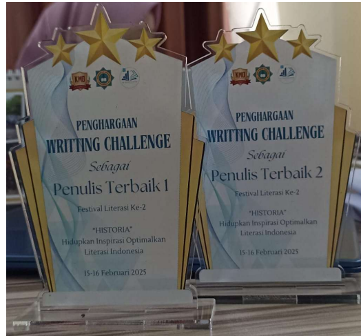
Gambar 7. Plakat untuk penulis terbaik guru

Setelah melalui tahap pendampingan dan penyempurnaan karya, hasil tulisan para guru dijadikan satu dalam bentuk antologi dan diterbitkan secara mandiri melalui media daring maupun cetak. Penerbitan ini bertujuan untuk memberikan apresiasi kepada guru yang telah berhasil menyelesaikan tulisan dengan baik, meningkatkan motivasi berkarya, serta mendokumentasikan proses dan capaian dalam pengembangan kompetensi menulis guru. Tidak hanya berhenti sampai di sana, sebagai bentuk apresiasi sekolah juga memberikan piagam penghargaan bagi penulis dan dua karya terbaik akan mendapatkan plakat. Hamalik (2010) menyatakan bahwa penghargaan/apresiasi dapat meningkatkan motivasi, mendorong kreativitas, serta memperkuat komitmen terhadap tugas yang dijalankan. Sejalan dengan yang disampaikan oleh Suyatno (2017) bahwa publikasi karya tulis guru tidak hanya sebagai bentuk aktualisasi diri, tetapi juga bentuk nyata dalam membangun budaya literasi sekolah.