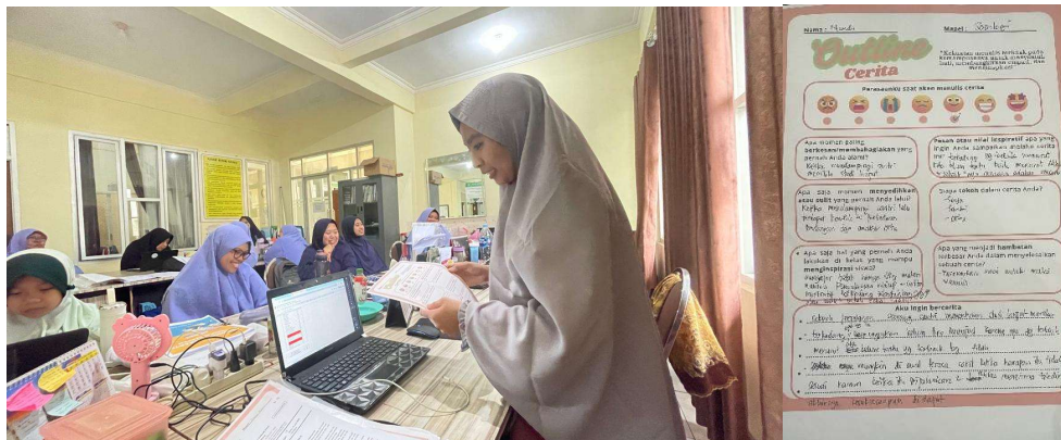
Gambar 2. Sosialisasi kegiatan workshop dan pembagian outline menulis

pengalaman di lapangan dan mengangkat kisah-kisah inspiratif berdasarkan pengalamannya. Pengalaman pribadi yang pernah dialami oleh individu bisa berupa kisah nyata akan memudahkan dalam penulisan cerita inspiratif (Hidayati, 2021).