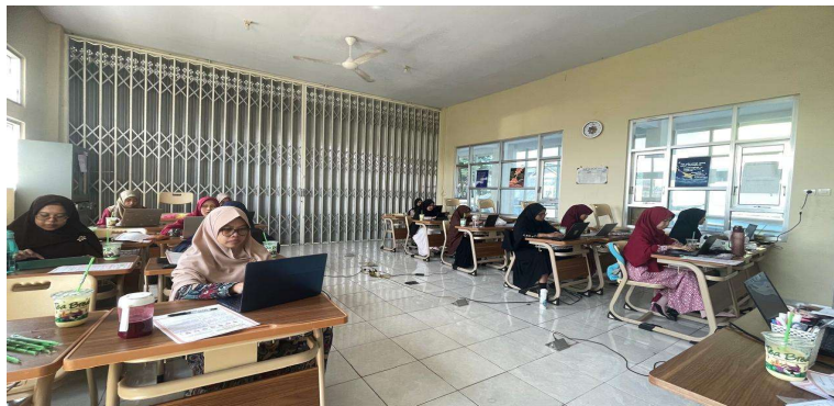
Gambar 5. Kegiatan pendampingan menulis guru

Kegiatan ketiga evaluasi/refleksi, kegiatan yang dilakukan dengan meninjau atau merefleksikan hasil karya cerita yang telah ditulis. Peserta diminta membaca ulang tulisannya dan melakukan penyuntingan. Kegiatan ini dilakukan sebagai bentuk refleksi bagi guru mengenai pentingnya literasi. Sejalan dengan pendapat yang disampaikan oleh Sudirman, Gemilang & Kristanto (2021) bahwa meninjau dan menyunting naskah melalui jurnal refleksi dapat membantu mereka dalam memperbaiki struktur, kosa kata, dan ide dalam cerita. Pendampingan menulis yang berbasis coaching and mentoring dalam meningkatkan kompetensi guru secara kolaboratif, partisipatif, dan reflektif sehingga guru didorong untuk berpikir kritis praktik menulis (Sari&Mulyasa, 2022).