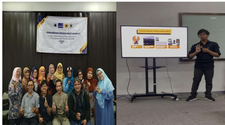
Gambar 4. Pelatihan Shopee Affiliate Tahap 3

Pada pelatihan ini dilakukan sharing cara mendownload video shopee yang lebih mudah dengan menggunakan laptop. Peserta pensiunan juga diberikan modul secara online untuk materi pelatihan tahap 3 ini . Berikut ini dokumentasi untuk pelatihan shopee affiliate tahap tiga.