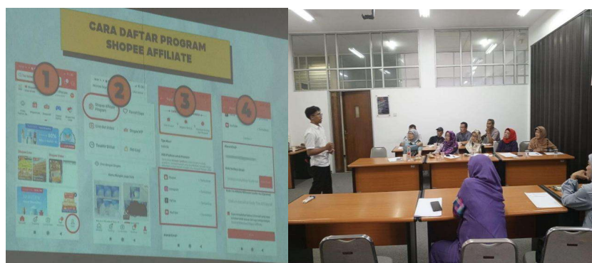
Gambar 2. Cara Daftar Program Shopee Affiliate

Selain itu pada pelatihan tahap satu ini peserta diberi wawasan pengetahuan tentang cara mempromosikan produk pada shopee affiliate melalui share link. Peserta yang sudah diterima di shopee affiliate bisa langsung share link, tetapi untuk peserta yang belum diterima, mereka tidak dapat mempraktekkan share link. Akan tetapi walaupun belum bisa share link, peserta sudah dapat memahami bagaimana cara marketing untuk shopee affiliate melalui share link tersebut. Berikut ini adalah gambar dari langkah-langkah cara mendaftar program shopee affiliate yang dipresentasikan oleh pemateri kepada peserta pensiunan pada pelatihan tersebut.