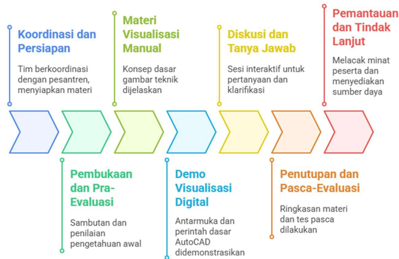
Gambar 1. Metode Pelaksanaan Pengabdian Kepada Masyarakat

Gambar 1 di atas menunjukkan alur metode pelaksanaan kegiatan pengabdian masyarakat yang dirancang secara sistematis dan partisipatif. Tahapan dimulai dari Koordinasi dan Persiapan, di mana tim pengabdian melakukan komunikasi dengan mitra (dalam hal ini, Pesantren Quantum Bekasi), sekaligus mempersiapkan materi pelatihan dan logistik yang dibutuhkan. Pendekatan ini sejalan dengan temuan Farichan et al. (2022), yang menekankan pentingnya koordinasi awal dengan masyarakat sasaran untuk memastikan program yang dilaksanakan sesuai dengan kebutuhan lokal (Farichan et al., 2022).