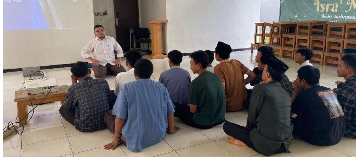
Gambar 3. Sesi Diskusi

Setelah seluruh materi disampaikan dan sesi diskusi dilaksanakan, dilakukan post-test guna mengukur peningkatan pemahaman peserta dibandingkan dengan kondisi awal saat pre-test. Hasil evaluasi ini memberikan gambaran kuantitatif mengenai efektivitas metode pelatihan yang telah diterapkan, sebagaimana ditampilkan dalam tabel berikut. Kepuasan peserta terhadap metode pelatihan yang diterapkan juga terkonfirmasi melalui hasil post-test dan observasi, mendukung temuan Fitriani dan Widodo (2021) bahwa kepuasan peserta erat kaitannya dengan keterlibatan aktif selama pelatihan.