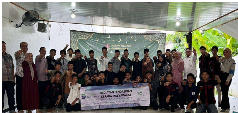
Gambar 4. Penutupan Kegiatan

Dokumentasi visual selama kegiatan digunakan sebagai bahan refleksi peserta dan penyusunan laporan, sebagaimana diusulkan oleh Yusuf dan Hidayat (2022) sebagai bagian dari evaluasi program berbasis portofolio. Meskipun dilakukan di lingkungan non-teknik, pelatihan berhasil memperkuat literasi digital peserta, mendukung studi Ramadhan dan Firdaus (2018) mengenai pentingnya adaptasi teknologi dalam konteks pendidikan alternatif. Kegiatan ini juga mempererat kolaborasi antara perguruan tinggi dan institusi pendidikan menengah, sebagaimana direkomendasikan oleh Setiawan dan Nuraini (2020) untuk keberlanjutan program pengabdian. Beberapa santri menyatakan minat melanjutkan studi di bidang teknik, menunjukkan pengaruh positif pelatihan terhadap orientasi karier (Syamsudin & Pratiwi, 2021).