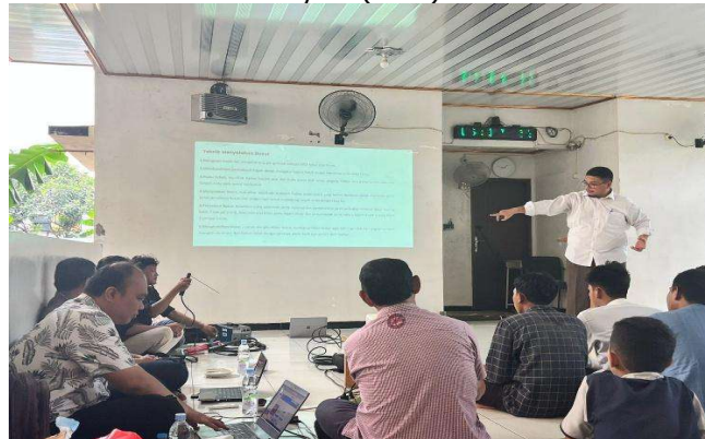
Gambar 2. Pemaparan Materi Gambar Teknik

Setelah peserta memahami konsep dasar melalui pendekatan manual, kegiatan kemudian dilanjutkan dengan pengenalan alat bantu digital, yaitu perangkat lunak AutoCAD, sebagai langkah berikut dalam membangun literasi teknis secara komprehensif. Sesi ini berperan penting dalam memperkenalkan konsep gambar teknik secara klasikal. Metode ini terbukti efektif memfasilitasi pemahaman santri terhadap elemen dasar gambar bangunan. Beberapa peserta bahkan turut menggambar di papan tulis. Aktivitas ini memperkuat peran visualisasi manual dalam menyampaikan konsep spasial, sebagaimana dibuktikan oleh Prabowo dan Nugroho (2019), yang menyatakan bahwa sketsa tangan dapat membentuk persepsi ruang lebih kuat di kalangan pemula. Penyediaan modul ringkas pascapelatihan turut berperan sebagai sarana belajar mandiri yang efektif, seperti disarankan oleh Anwar dan Puspitasari (2021) dalam pengembangan media ajar teknis sederhana. Pendekatan visual-kinestetik melalui sketsa manual terbukti mampu memperkuat pemahaman spasial peserta, sebagaimana dikemukakan oleh Sari dan Wahyuni (2019).