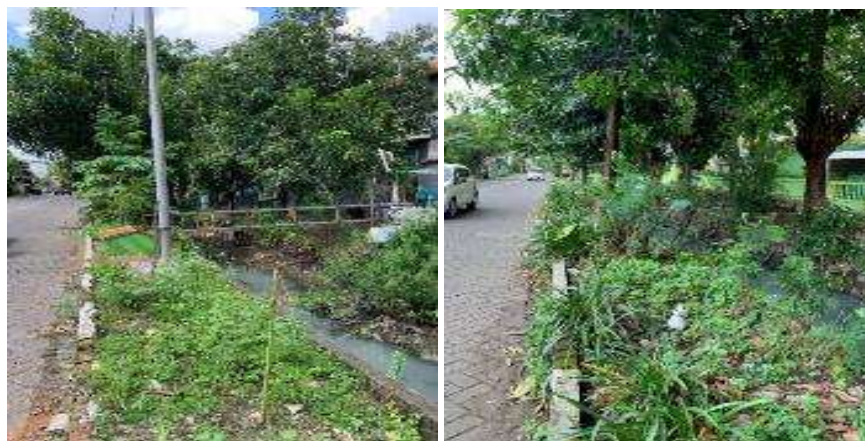
Gambar 2. Kondisi Eksisting Trotoar

Survei kondisi eksisting merupakan tahap awal yang dilakukan untuk mendokumentasikan kondisi fisik trotoar saat ini secara visual dan deskriptif seperti pada Gambar 2. Survei ini mencakup pengukuran lebar efektif dan ketinggian trotoar sebagai dasar evaluasi kondisi eksisting jalur pejalan kaki. Data digunakan dalam pemetaan kriteria perbaikan dan pemenuhan standar (Faisal et al., 2021). Tim survei mencatat elemen-elemen seperti lebar trotoar, material permukaan, kerusakan struktural, keberadaan pohon, rambu lalu lintas, serta hambatan fisik. Survei ini juga mencakup observasi perilaku pengguna, titik genangan, serta potensi ketidaksesuaian fungsi trotoar.