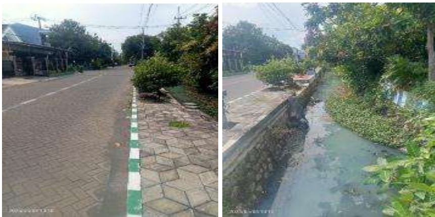
Gambar 3. Kondisi Eksisting STA +380

“Pengukuran beda tinggi dilakukan menggunakan theodolit melalui pembacaan back sight dan fore sight , kemudian dihitung selisih elevasi antar titik sesuai prosedur praktikum survei tanah” (Iskandar & Purwanto, 2018). Survei pengukuran beda tinggi trotoar bermanfaat untuk mendukung analisis teknis terhadap kondisi eksisting jalur pedestrian di Perumahan Rewwin, dilakukan survei pengukuran beda tinggi (elevasi) pada segmen-segmen trotoar menggunakan alat theodolit. Tujuan pengukuran ini adalah untuk memperoleh data elevasi aktual guna mengidentifikasi ketidakteraturan permukaan, kemiringan yang terlalu curam, serta potensi genangan air akibat kemiringan tanah seperti pada Gambar 4.