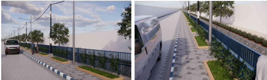
Gambar 6. Desain Trotoar 3D