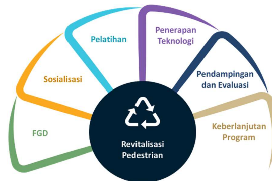
Gambar 1. Metode Pelaksanaan Kegiatan Pengabdian

Pelaksanaan kegiatan pengabdian kepada masyarakat dilakukan observasi dan survei secara langsung yang bertujuan untuk menggambarkan kondisi eksisting jalur pedestrian di jalan Raya Waru Perumahan Rewwin, Waru, Kabupaten Sidoarjo secara mendalam serta merumuskan strategi pengembangan dan pengelolaan pedestrian berdasarkan temuan lapangan dan kajian literatur. Kegiatan pengabdian dilakukan secara sistematis untuk mencapai tujuan dan tepat sasaran yang digambarkan pada Gambar 1.