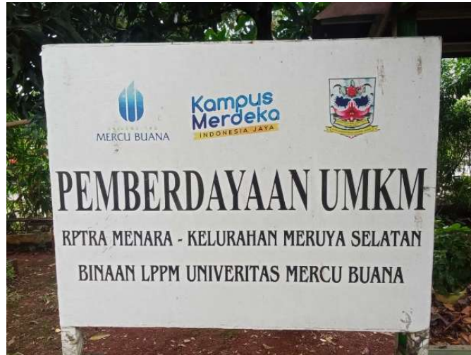
Gambar 2. Binaan LPPM Universitas Mercu Buana

Bahan pelatihan dibagikan pada peserta terkait materi teoritis mapun praktek. Materi pelatihan langsung di ajarkan (Gambar 3) dan dipraktekkan oleh peserta tahap demi tahap. Bahan pelatihan sepenuhnya disiapkan oleh tim pelaksana dan boleh di bawa pulang oleh peserta. Instruktur memberikan penjelasan tentang bahan-bahan yang diperlukan serta tata cara pelaksanaannya sampai menjasi sebotol sampo. Peserta melihat dan mempraktek kan langsung di lokasi dengan arahan instruktur.