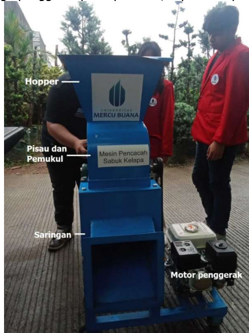
Gambar 4. Komponen Utama Mesin Serabut Kelapa

hasil olahan agar serat dan cocopeat terpisah sempurna dan motor penggerak menggunakan mesin bensin sebagai sumber tenaga penggerak pisau pemukul, seperti tampak pada Gambar 4.