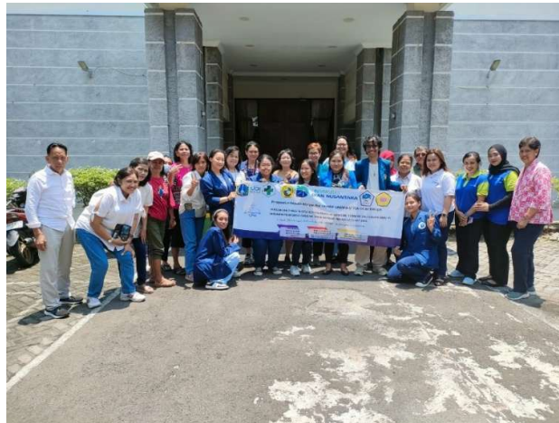
Gambar 7. Foto Bersama partisipan, Tenaga Kesehatan PUSKESMAS Tanjung Priok, UKRIDA, UNDIRA, STTIJA, STTBETHESDA, dan GPSI Soteria

Kegiatan pengabdian kepada masyarakat ini difokuskan pada skrining dini kanker serviks bagi wanita yang telah menikah atau pernah melakukan hubungan seksual. Sedangkan pemeriksaan tensi, gula darah, asam urat, dan kolesterol dilakukan sebagai pemeriksaan lanjutan agar partisipan tertarik memeriksakan diri skrining dini kanker serviks, selain itu juga partisipan akan mendapatkan minyak goreng \frac{1}{2} liter sebagai apresiasi PUSKESMAS Tanjung Priok kepada partisipan yang secara sukarela memiliki kesadaran pentingnya melakukan skrining dini kanker serviks.