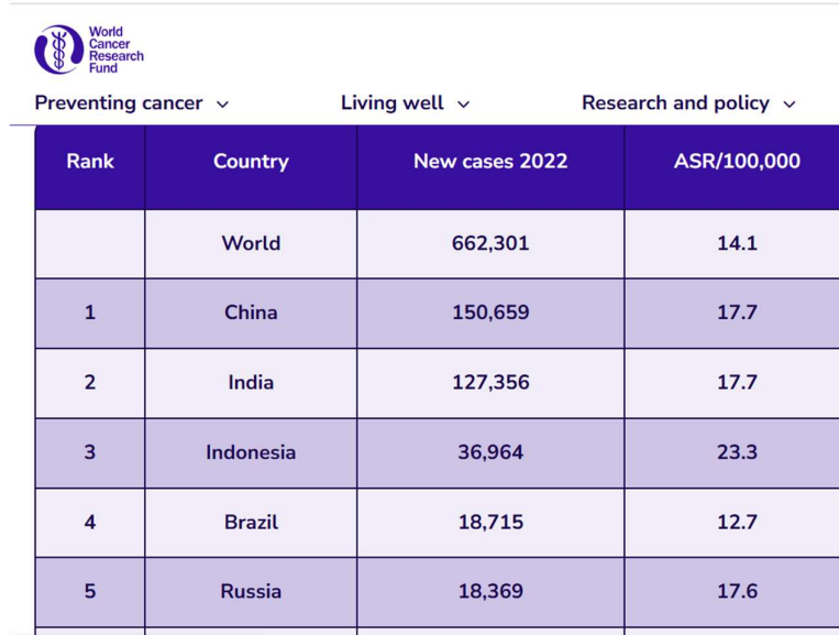
Gambar 2. Data World Cancer Research Fund

Berdasarkan sajian informasi di atas, terlihat tingginya jumlah angka penderita penyakit kanker serviks pada wanita. Hal tersebut seringkali dikaitkan dengan masih rendahnya pengetahuan dan tingkat kesadaran diri untuk melakukan deteksi dini atau skrining dini kanker serviks (Ahmad et al., 2021), (Mariana, 2019). Untuk menekan jumlah bertambah banyaknya lagi penderita kanker serviks, perlu ada peran dari pihak lain yang membantu memberikan insight bahwa betapa pentingnya untuk mulai melakukan deteksi atau skrining kanker serviks sedini mungkin sebagai upaya antisipasi pencegahan.