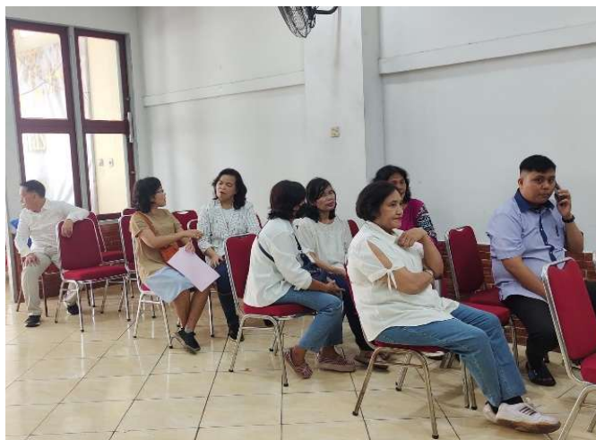
Gambar 4. Peserta partisipan yang telah terdaftar

Rangkaian kegiatan proses pelaksanaan adalah sebagai berikut: