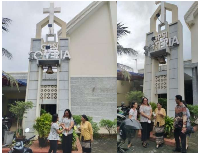
Gambar 3. Pertemuan PUSKESMAS Tanjung Priok, UKRIDA, STTBETHESDA dan GPSI Soteria

Dalam tahap persiapan ekstern ini masing-masing Perguruan Tinggi UKRIDA, UNDIRA, STTIJA, STTBETHESDA menentukan waktu untuk bertemu dengan pihak GPSI Soteria sebagai tempat pelaksanaan kegiatan di hari H dan pertemuan dengan pihak PUSKESMAS Tanjung Priok untuk membicarakan teknis pelaksanaan kegiatan pengabdian kepada masyarakat di lapangan pada hari H sesuai waktu yang ditentukan oleh PUSKESMAS Tanjung Priok. Dalam pertemuan ini PUSKESMAS Tanjung Priok memberikan informasi terkait program yang ditawarkan untuk dilaksanakan yakni pemeriksaan deteksi skrining dini kanker serviks dan pemeriksaan gratis tensi, gula darah, asam urat dan kolesterol bagi peserta terdaftar. Koordinasi dilanjutkan dengan WhatsApp Group (WAG) setelah pertemuan secara langsung selesai dilakukan.