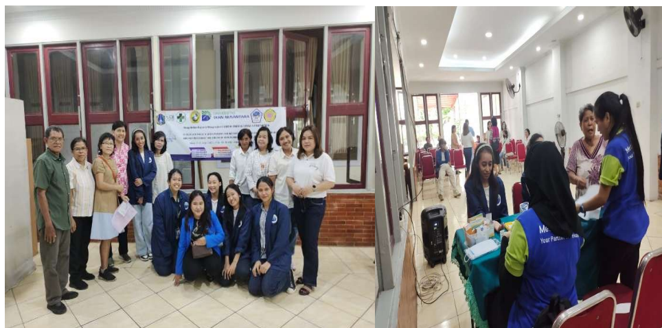
Gambar 5. Tim Pelaksana Lapangan dari UKRIDA, UNDIRA, STTIJA, STTBETHESDA (Dosen dan Mahasiswa), GPSI Soteria, dan Tenaga Kesehatan PUSKESMAS Tanjung Priok