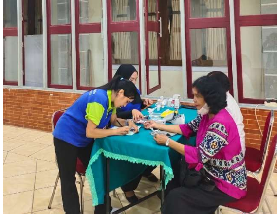
Gambar 6. Pemeriksaan skrining dini kanker serviks dilanjutkan pemeriksaan tensi, gula darah, asam urat dan kolesterol oleh tenaga kesehatan PUSKESMAS Tanjung Priok