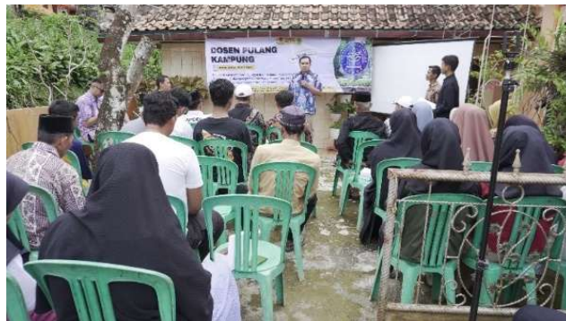
Gambar 2. Pembukaan Kegiatan oleh Ketua Tim Dosen Pulang Kampung IPB

Pada tahap pembukaan ketua tim pengabdian Dosen Pulang Kampung merupakan warga asli dari desa Pakapasan Girang yang membawa hasil pengembangan teknologi komunikasi cerdas berbasis smartphone untuk diimplementasikan. Pembukaan acara pengabdian dosen pulang kampung IPB oleh ketua tim pelaksana kegiatan dapat dilihat pada Gambar 2.