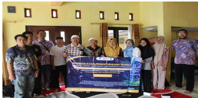
Gambar 4. Pelatihan Perakitan Alat dan Aplikasi Komunikasi Cerdas

Pelatihan tahap satu yaitu pembuatan modul alat komunikasi cerdas terdiri dari tiga tahap yaitu tahapan pre-test , pelatihan perakitan alat dan post-test . Pelatihan diawali dengan proses pre-test dimana seluruh peserta akan diberikan beberapa soal untuk dikerjakan sehingga dapat diidentifikasi pemahaman awal para peserta terkait dengan aplikasi cerdas komunikasi untuk keamanan lingkungan. Kegiatan pre-test akan dianalisis dengan melihat kolerasinya dengan hasil post-test sehingga dapat memberikan kesimpulan seberapa jauh pelatihan dapat meningkatkan pemahaman dan kemampuan peserta dalam mengembangkan alat komunikasi cerdas. Kegiatan pelatihan pembuatan alat komunikasi cerdas dapat dilihat pada Gambar 4.