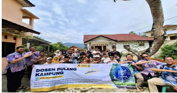
Gambar 3. Peserta Pelatihan Pengabdian Kepada Masyarakat