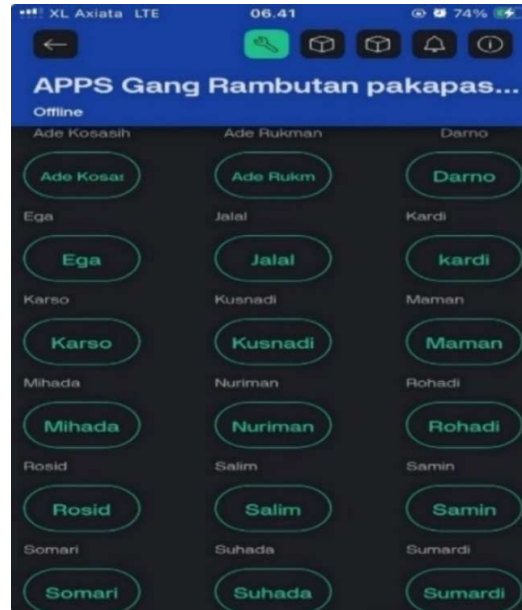
Gambar 8. Aplikasi Blynk Komunikasi Cerdas Berbasis Android

Penentuan peserta terbaik pelatihan dilakukan untuk menentukan berdasarkan nilai pre-test dan post-test beserta nilai dari ketepatan dan kecepatan perancangan modul komponen komunikasi cerdas. Berdasarkan hasil pelatihan terdapat satu peserta yang memiliki kemampuan untuk merancang secara cepat dan tepat modul alat komunikasi cerdas dan nilai test yang dilakukan.