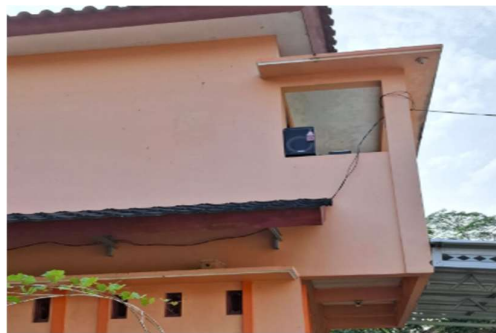
Gambar 12. Implementasi Pemasangan Alat Komunikasi Cerdas

Berdasarkan hasil analisis bayes didapatkan lokasi yang ideal untuk pemasangan alat komunikasi cerdas sebagai pengembangan sistem keamanan lingkungan yaitu di rumah salah satu warga desa dengan nilai alternatif 4,2. Lokasi ini dipilih karena memiliki jangkauan internet, jangkauan suara dan ketersediaan listrik yang memadai sehingga semua warga dapat mendengar bila ada suara himbuan untuk berkumpul akibat permasalahan keamanan lingkungan. Pemasangan alat dapat dilihat pada Gambar 12.