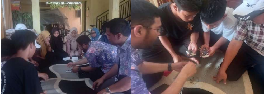
Gambar 6. Pelatihan Perakitan Komponen Modul Alat Komunikasi Cerdas

Proses pelatihan dilakukan dengan kegiatan pre-test dan post-test serta proses perakitan alat komunikasi cerdas agar terhubung dengan smartphone dan speaker . Setelah pre-test dilakukan maka proses selanjutnya adalah pelatihan perakitan komponen alat. Pelatihan ini dilakukan bersama sama dengan peserta dengan tujuan agar alat dapat diproduksi dan dipasarkan langsung oleh warga melalui pengembangan UMKM desa Pakapasan Girang. Proses pelatihan komponen modul alat komunikasi cerdas dapat dilihat pada Gambar 6.