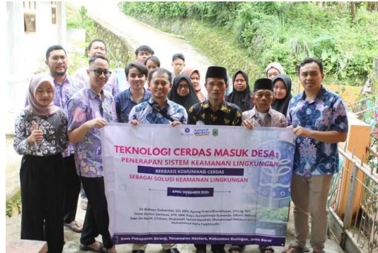
Gambar 11. Pelatihan Penentuan Lokasi Ideal Sistem Keamanan Lingkungan Cerdas

Berdasarkan hasil pelatihan tahap satu yaitu perakitan modul aplikasi komunikasi cerdas maka didapatkan peserta terbaik dimana modul yang dihasilkan akan diimplementasikan di lingkungan warga desa. Penentuan lokasi yang tepat pada pelatihan tahap dua menggunakan teknik Multi Criteria Decision Making (MCDM) yaitu bayes berdasarkan alternatif dan kriteria yang sesuai. Pelatihan Penerapan Sistem Keamanan Lingkungan Berbasis Komunikasi Cerdas menurut lokasi yang ideal menggunakan metode bayes dapat dilihat pada Gambar 11.