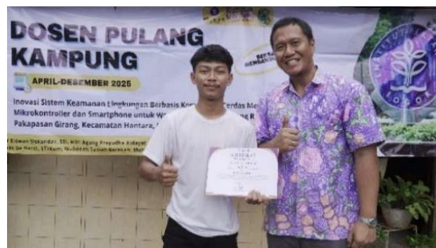
Gambar 10. Peserta Terbaik Pelatihan Perancangan Modul Alat Komunikasi Cerdas

Berdasarkan hasil penilaian kegiatan pelatihan yang terdiri dari pre-test , post-test , dan penilaian keberhasilan pengembangan modul maka didapatkan peserta terbaik yang modulnya akan diimplementasikan langsung sebagai alat komunikasi cerdas yang dapat memberikan informasi keadaan darurat kejahatan di lingkungan desa. Hasil perakitan modul alat komunikasi cerdas akan digunakan dalam pelatihan tahap 2 yaitu untuk pelatihan menentukan lokasi pemasangan alat yang optimal. Peserta terbaik pelatihan tahap satu dapat dilihat pada Gambar 10.