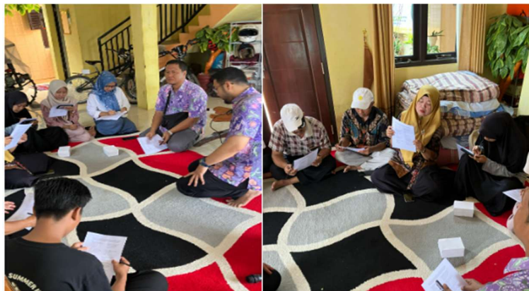
Gambar 5. Pre-Test dan Post-Test

Pelatihan alat komunikasi cerdas dilakukan melalui tiga tahap yaitu proses penilaian pr-test , pelatihan pembuatan alat dan post-test . Proses Pre-Test dilakukan diawal pelatihan untuk mengukur kemampuan awal dari pemahaman peserta pelatihan terhadap komponen alat komunikasi cerdas. Proses pre-test dan post-test menjadi dasar apakah pelatihan ini memberikan dampak terhadap peningkatan tingkat pengetahuan warga desa. Pre-test dan post-test dapat dilihat pada Gambar 5.