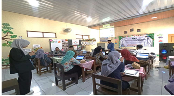
Gambar 1. Pelaksanaan Workshop Penggunaan AI

Berdasarkan gambar diatas kegiatan masyarakat dilaksanakan sebagai penghubung para guru SDN 1 Rajekwesi bersama-sama mengembangkan kemampuannya dalam membuat media pemanfaatan teknologi AI dalam pembelajaran berdiferensiasi. Kegiatan pengabdian kepada masyarakat dilakukan oleh tim pengabdian serta mahasiswa prodi Pendidikan Guru Sekolah Dasar FTIK Unisnu Jepara sejumlah 5 anggota. Pelatihan ini diikuti oleh seluruh guru SDN 1 Rajekwesi. Pengabdian ini berlangsung pada tanggal 23-24 September 2024. Pelaksanaan meliputi observasi awal, wawancara sebagai identifikasi kebutuhan sekolah, pre-test, pelatihan, pendampingan, post-test serta evaluasi berkelanjutan setelah program selesai.