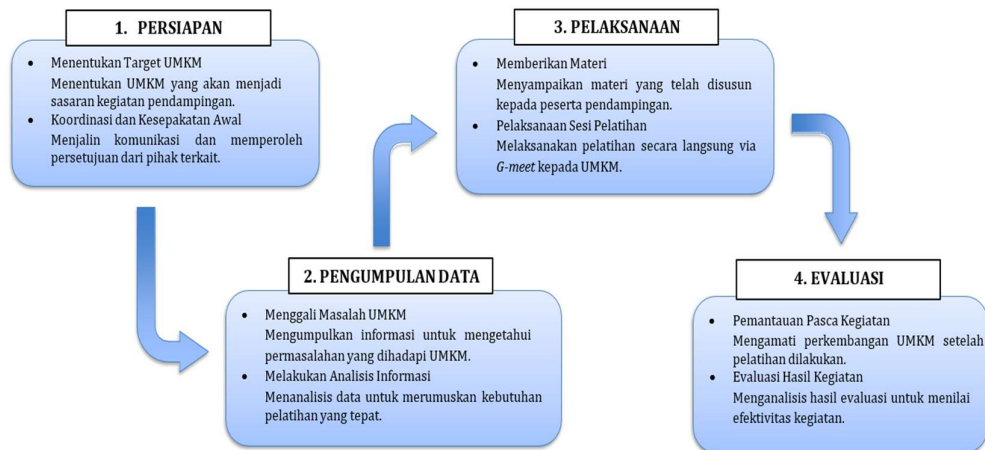
Gambar 1. Proses Pelaksanaan Pendampingan

Kegiatan pelaksanaan pendampingan dimulai dengan tahapan persiapan dan koordinasi awal dengan pemilik untuk mendapatkan persetujuan dari masing-masing pihak dalam pelaksanaan pengabdian. Pada tahap pengumpulan data tim melakukan wawancara untuk menggali masalah dan menganalisis informasi yang didapat guna mencari solusi. Selanjutnya, dalam proses pelaksanaan tim melakukan edukasi melalui diskusi online yang diselenggarakan via G-Meet . Materi yang disampaikan dalam kegiatan pendampingan mencakup pemahaman dasar akuntansi, seperti pencatatan laporan laba rugi, laporan posisi keuangan (neraca), serta catatan atas laporan keuangan, agar mitra menyadari bahwa laporan keuangan sangat krusial untuk menjaga keberlangsungan usaha dan mendukung pengambilan keputusan yang tepat.