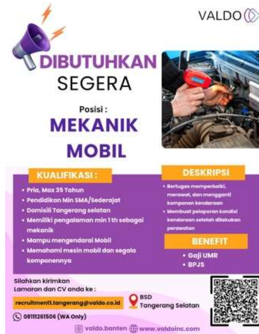
Gambar 2. Flyer Desain Posisi Mekanik Mobil

Flyer digital tersebut disebarluaskan melalui beberapa platform, yaitu Instagram, OLX, dan Indeed. Setiap platform memiliki karakteristik audiens yang berbeda, sehingga strategi penyebaran juga menyesuaikan. Jadwal posting diatur setiap awal dan pertengahan minggu, dengan waktu unggah yang disesuaikan berdasarkan waktu aktif audiens (pukul 10.00–13.00 WIB).