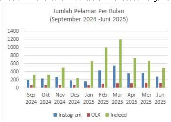
Gambar 4. Jumlah Pelamar per Bulan

Secara keseluruhan, kegiatan pengabdian ini menunjukkan bahwa pemanfaatan teknologi, dalam hal ini Canva dan sistem pengelolaan data yang lebih terstruktur, memberikan dampak positif yang nyata. Implementasi ini tidak hanya mempercepat proses rekrutmen dan meningkatkan akurasi data, tetapi juga turut mendukung peningkatan kualitas sumber daya karyawan. Hal ini sejalan dengan peran penting rekrutmen dalam menentukan kualitas SDM di sebuah organisasi.