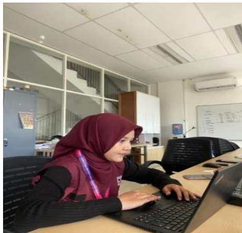
Gambar 5. Dokumentasi Kegiatan

Sebagai kesimpulan, data ini secara tegas menyoroti Indeed sebagai platform unggulan untuk menarik jumlah pelamar terbesar, diikuti oleh Instagram yang memberikan kontribusi stabil. OLX, di sisi lain, kurang menunjukkan efektivitas dalam menjangkau pelamar. Insight ini sangat berharga bagi tim rekrutmen untuk mengalokasikan sumber daya secara lebih strategis, fokus pada platform yang terbukti efektif, dan mungkin mengevaluasi kembali penggunaan platform dengan performa rendah di masa yang akan datang.