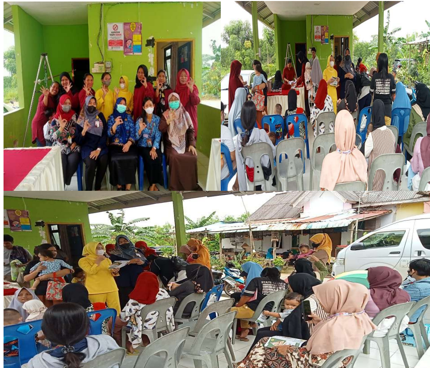
Gambar 1. Penyuluhan Pendidikan Kesehatan Tentang Imunisasi Dasar

Kegiatan tersebut dilaksanakan pada tanggal 19 Februari 2025, melibatkan Bidan PMB yang bertugas di tempat tersebut. Acara ini dihadiri oleh sepuluh peserta yang merupakan ibu dari bayi dan balita. Penyuluhan tersebut dilakukan dengan memberikan materi mengenai pentingnya imunisasi, mencakup definisi, jenis, dan keuntungan dari setiap imunisasi yang ada, untuk mencegah kesakitan akibat penyakit serta kemungkinan terjadinya kecacatan atau kematian. Tujuan utama dari penyuluhan ini adalah, pertama, untuk menyebarkan informasi mengenai imunisasi dan signifikansinya, dan kedua, untuk mendekati para ibu yang memiliki bayi berusia 0 hingga 1 tahun yang belum bersedia memberikan imunisasi.