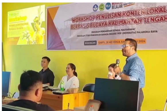
Gambar 1. Sesi Pelatihan Penulisan Konten Lokal

Di akhir kegiatan, artikel yang telah ditulis oleh para peserta akan dianalisis bersama sesuai dengan rubrik. Metode evaluasi menggunakan rubrik dipilih karena dapat memberikan framework yang jelas dalam evaluasi terhadap kemampuan menulis (Ali et al., 2023). Rubrik pada kegiatan ini adalah sebagai berikut.