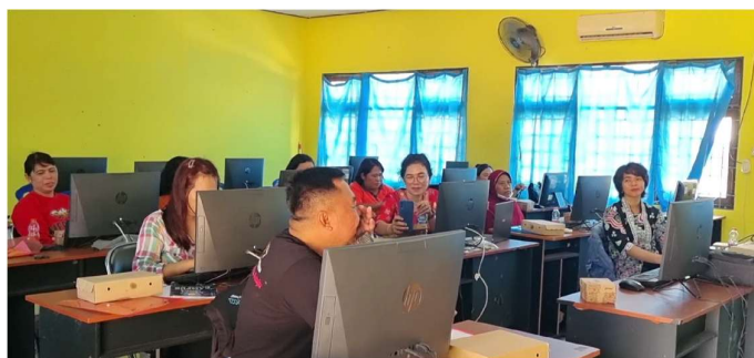
Gambar 2. Peserta Kegiatan

Workshop penulisan konten lokal berbasis budaya untuk guru-guru di Kalimantan Tengah mendapat tanggapan positif dari para peserta. Sebagian besar peserta setuju bahwa materi yang disampaikan relevan dengan kebutuhan mereka sebagai pendidik, dengan 57,1% sangat setuju dan 42,9% setuju. Selain itu, workshop ini berhasil meningkatkan keterampilan menulis konten lokal berbasis budaya, yang diakui oleh seluruh peserta. Hasil ini menunjukkan bahwa tujuan utama workshop dalam meningkatkan kompetensi guru dalam penulisan konten lokal telah tercapai dengan baik.