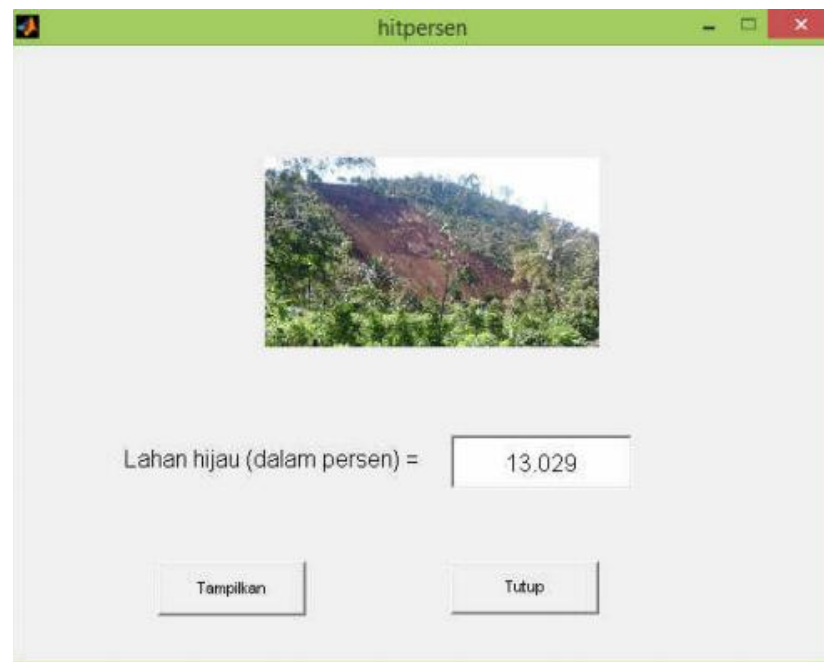
Gambar 3. Simulasi perhitungan terdampak menggunakan citra

Dengan mengetahui citra yang terdampak maka dapat diketahui seberapa luas area yang terpengaruh oleh bencana longsor.