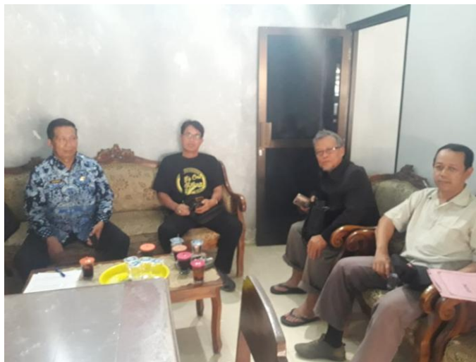
Gambar 1. Menemui perangkat desa

Terakhir, penting untuk melibatkan masyarakat melalui wawancara dengan warga lokal. Interaksi ini bertujuan untuk menggali informasi tambahan mengenai sejarah longsor di daerah tersebut dan pola tanda-tanda bahaya yang pernah mereka alami. Wawancara ini tidak hanya membantu dalam memahami persepsi masyarakat tentang daerah rawan, tetapi juga memanfaatkan pengetahuan lokal yang sering kali kaya akan informasi berharga untuk identifikasi risiko.