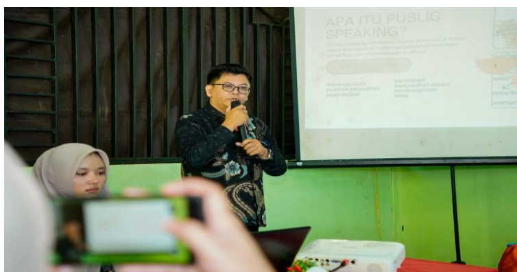
Gambar 4. Tahap pemberian feedback