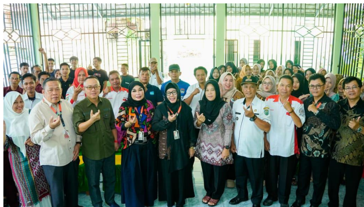
Gambar 3. Peserta