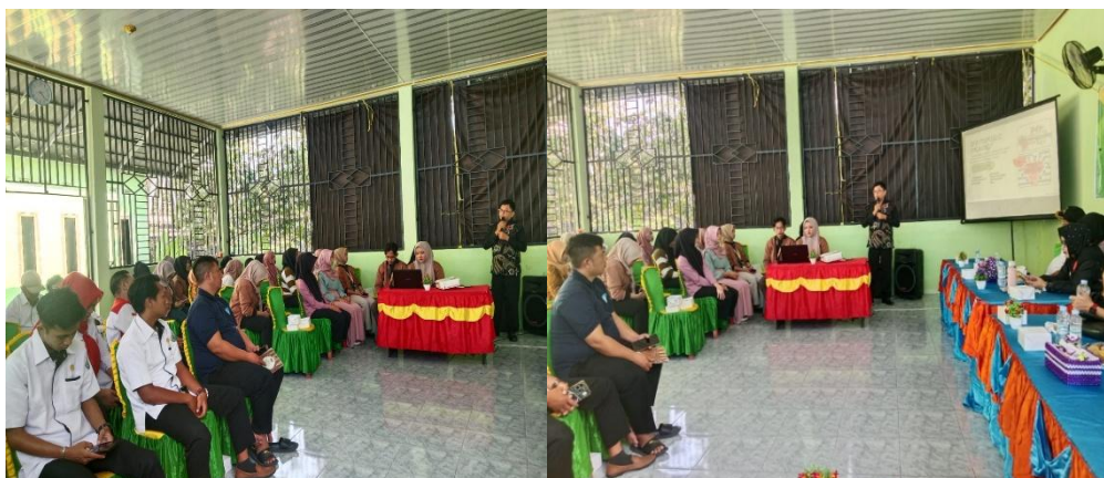
Gambar 2. Tahap Persiapan