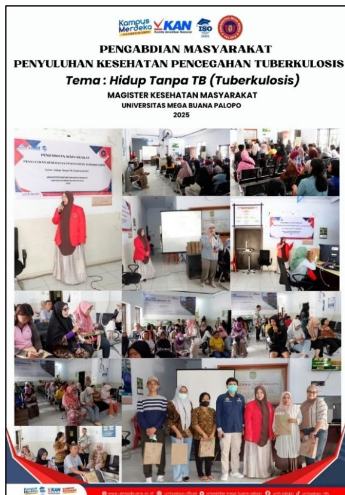
Gambar 2. Foto Kegiatan