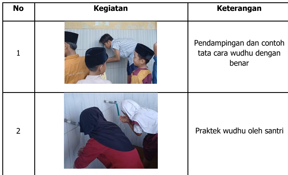
Tabel 1. Media manual papan tata cara wudhu dan timewheel

Ustadz/Ustadzah juga menyebutkan bahwa santri kini lebih siap menjalankan wudhu sebelum sholat berjamaah tanpa harus diingatkan satu per satu. Santri bahkan terlihat saling mengoreksi dan membantu teman mereka yang keliru dalam praktik wudhu, menunjukkan tumbuhnya pemahaman dan sikap tanggung jawab terhadap ibadah. Kesimpulan dari hasil praktek yaitu penerapan media manual berbasis visual sangat efektif dalam meningkatkan keterampilan ibadah santri, khususnya dalam melaksanakan wudhu. Peningkatan tersebut tidak hanya terlihat pada aspek penguasaan langkah-langkah, tetapi juga pada tumbuhnya pemahaman dan rasa percaya diri anak dalam beribadah. Hal ini membuktikan bahwa pendekatan pembelajaran yang menyenangkan, kontekstual, dan sesuai dengan gaya belajar anak usia dini sangat diperlukan dalam pendidikan agama di tingkat TPQ.