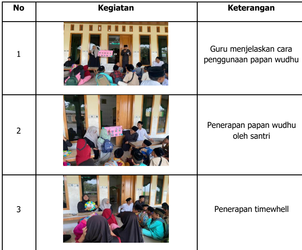
Tabel 2. Kegiatan penerapan media manual

Untuk menghindari suasana yang monoton dan membosankan, guru mengembangkan pendekatan yang menyenangkan dengan mengajak santri menyanyikan lagu yang liriknya berisi urutan wudhu. Lagu tersebut dikemas dengan irama ceria dan pengulangan yang mudah diikuti, sehingga santri secara tidak langsung menghafal urutan wudhu melalui aktivitas bernyanyi. Pendekatan ini terbukti efektif karena anak-anak lebih mudah menyerap informasi melalui irama dan pengulangan visual-auditori. Setelah sesi bernyanyi, kegiatan dilanjutkan dengan demonstrasi langsung menggunakan papan interaktif tata cara wudhu.