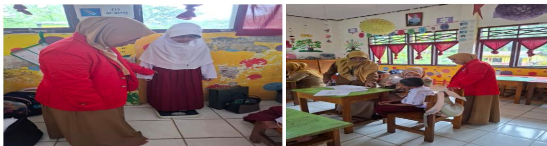
Gambar 5. Pengukuran Berat Badan untuk melihat status Gizi dan Pemeriksaan serumen pada telinga

Pemeriksaan tinggi badan, berat badan, kebersihan gigi, kuku, rambut, dan telinga siswa SDN 233 Ussu serta Pencatatan hasil pemeriksaan