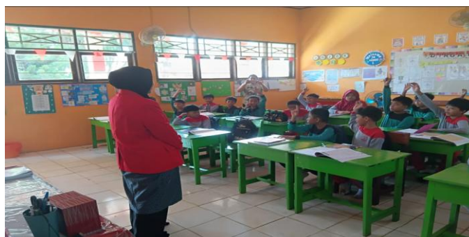
Gambar 3. Penyuluhan dan Pre Test Dokter Kecil SDN 233 Ussu

Materi disampaikan dengan pendekatan edukatif, interaktif, dan menyenangkan (menggunakan media visual, cerita, atau simulasi). Penyuluhan fokus pada tugas dokter kecil, cara menjaga kebersihan diri, cara menolong teman yang mengalami gejala ringan dan pentingnya pemeriksaan kesehatan rutin