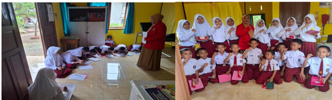
Gambar 6. Pelaksanaan Post Test dan Penutupan Kegiatan

Pada tahap ini dilakukan Post Test setelah sesi penyuluhan selesai dengan menggunakan pertanyaan yang sama dengan pre test yang bertujuan untuk melihat perubahan Tingkat pengetahuan siswa setelah mengikuti penyuluhan. Setelah dilakukan penyuluhan dan dilakukan Post tes dengan hasil menunjukkan 17 orang dokter kecil ( nilai > 9) memiliki Tingkat pengetahuan baik (dan 3 orang (nilai 8-9) memiliki pengetahuan cukup. Jawaban siswa pre test dan post test dikumpulkan kemudian dibandingkan untuk melihat peningkatan atau perubahan pemahaman.