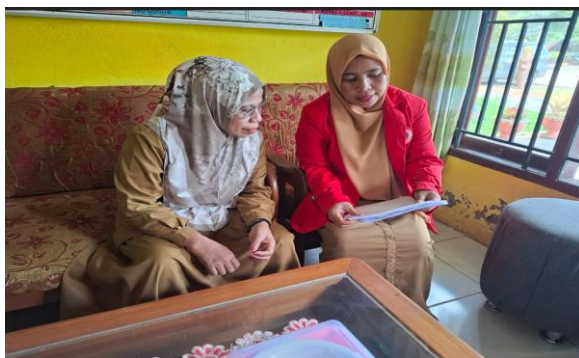
Gambar 2. Koordinasi Dengan Pihak Sekolah SDN 233 Ussu Kec. Malili Kab. Luwu Timur

Pelaksanaan program dilaksanakan pada tanggal 18 – 22 Juli 2025. Adapun tahapan pelaksanaan sebagai berikut :