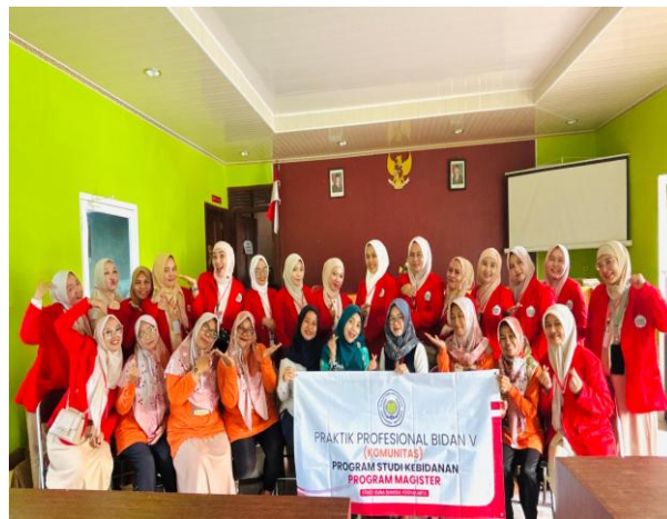
Gambar 4. Kader dan Mahasiswa Guna Bangsa