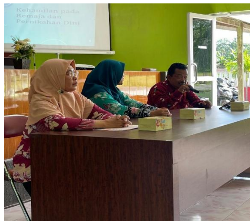
Gambar 1. Sambutan Kepala Dusun

Sasaran utama kegiatan ini adalah kader kesehatan dan kader PKK di Dusun Sorosutan sebagai garda terdepan dalam pencegahan pernikahan usia anak dan kehamilan remaja. Rekrutmen peserta dilakukan melalui koordinasi dengan perangkat desa, bidan desa, dan tokoh masyarakat setempat menggunakan metode purposive sampling berdasarkan kriteria keterjangkauan geografis, kesediaan berpartisipasi, dan komitmen mengikuti seluruh rangkaian pelatihan. Jumlah kader yang berhasil dijangkau dan aktif mengikuti program sebanyak 21 orang kader yang memenuhi kriteria sasaran. Komposisi peserta ini dianggap optimal untuk memungkinkan interaksi yang efektif dalam proses edukasi, transfer pengetahuan, simulasi penyuluhan, serta memfasilitasi diskusi interaktif yang mendalam tentang strategi edukasi kesehatan reproduksi di tingkat masyarakat.