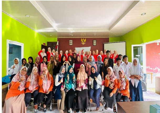
Gambar 3. Kader Setelah Kegiatan