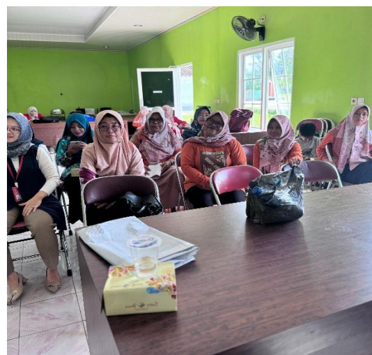
Gambar 2. Proses Materi untuk Kader