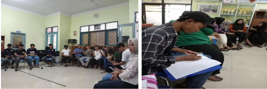
Gambar 2. Respon Remaja Desa Durajaya

rasa alami dari Cimplonya. Dan kalo saya boleh kasih saran dikasih toping keju dan strawberry agar menjadi lebih enak saat dimakan” ucap mas dadan, “saya gak suka Cimplo tapi setelah saya coba Cimplo yang sudah di modifikasi rasa seperti ini ternyata enak dan saya sekarang jadi menyukainya apalagi rasa coklat” ucap the alya, “ternyata Cimplo di modifikasi seperti ini enak juga apalagi rasa coklatnya” ucap mas Vicky, “cimplo varian rasa ini enak tapi lebih enak lagi ada varian rasa seperti taro dan lainnya” ucap mas dimas.