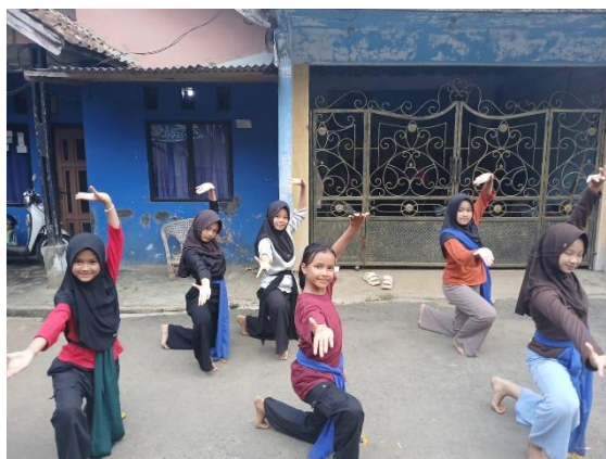
Gambar 4. Latihan Tarian Daerah

Tujuan dari kegiatan ini adalah memberikan ruang bagi anak-anak untuk menyalurkan bakat seni, memperkenalkan serta melestarikan budaya lokal, sekaligus melatih rasa percaya diri mereka ketika tampil di depan umum. Antusiasme anak-anak tidak kalah dengan kegiatan bimbingan di Posko Impian, terlihat dari semangat mereka mengikuti setiap sesi latihan. Dengan adanya kombinasi kegiatan akademik melalui Posko Impian dan non-akademik melalui latihan tarian daerah, diharapkan anak-anak dapat tumbuh secara seimbang, baik dalam aspek pengetahuan maupun keterampilan seni. Selain itu, kegiatan ini juga menjadi wadah kebersamaan antara mahasiswa, tokoh masyarakat, dan anak-anak dalam membangun lingkungan belajar yang menyenangkan sebagaimana ditunjukkan pada Gambar 5.