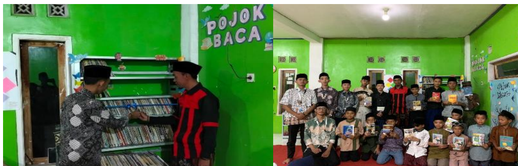
Gambar 2. Pengesahan Pojok Baca di Majelis Miftahussa'adah

Namun di era saat ini minat baca anak sangatlah kurang, mereka lebih sering bermain gadget dibandingkan membaca buku-buku pengetahuan. Padahal banyak manfaat yang dapat diperoleh dari membaca. Banyak faktor yang menjadi penyebab rendahnya minat baca anak salah satunya adalah karena semakin berkembangnya teknologi. Kurangnya minat anak dalam membaca juga dapat dipengaruhi karena kurangnya sarana yang tersedia. Tidak adanya tempat untuk membaca (perpustakaan) dan tidak adanya buku bacaan yang memadai (Rusmiati Aliyyah dkk., 2021). Untuk menumbuhkan sekaligus meningkatkan kesadaran akan pentingnya membaca, mahasiswa pengabdian kepada masyarakat menginisiasi program pengadaan Pojok Baca di Desa Legokhuni. Setelah melakukan koordinasi dengan berbagai pihak, mahasiswa pengabdian kepada masyarakat memutuskan pengadaan pojok baca ditempatkan di Majelis Miftahussa'adah yang terletak di RT 01/RW 01 Desa Legokhuni, sebagaimana tampak pada berikut.