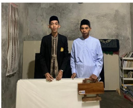
Gambar 5. Penyerahan Fasilitas Belajar oleh Mahasiswa KKN

Pelaksanaan kegiatan dilakukan melalui beberapa tahap. Pertama, mahasiswa melakukan survei kebutuhan untuk mengetahui fasilitas apa saja yang paling mendesak dibutuhkan. Kedua, dilakukan penggalangan dana serta koordinasi dengan pihak majelis dan tokoh masyarakat agar program dapat berjalan dengan lancar. Ketiga, mahasiswa KKN menyerahkan secara langsung bantuan fasilitas belajar tersebut kepada pengurus majelis sebagaimana nampak pada gambar berikut.