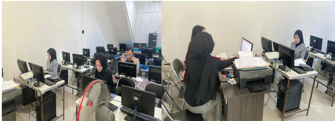
Gambar 3. Pelaksanaan Pengabdian