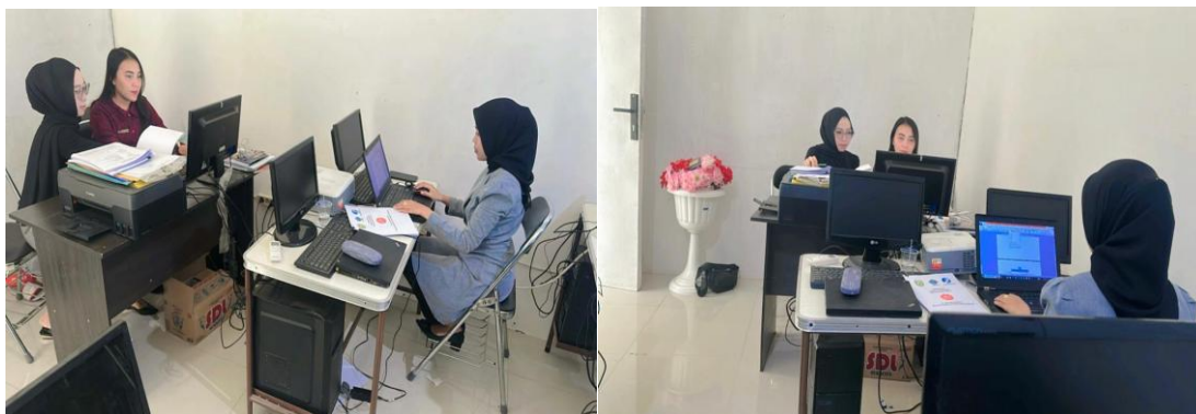
Gambar 4. Pemberian Materi tentang literasi keuangan

Pelaksanaan pelatihan dan literasi keuangan ditujukan agar karyawan PT. Arsuya Palembang dapat menerapkan/mengimplementasikan hasil dari metode pendekatan pelatihan. Dalam hal ini pendampingan mencakup pendampingan daya kreativitas dan inovasi dan pendampingan pengelolaan keuangan, terutama literasi keuangan. Dalam pendekatan pendampingan ini mitra didampingi oleh tim dan tenaga pendamping, Ini bertujuan untuk memastikan bahwa mitra dapat menerapkan hasil pelatihan dengan bantuan dan bimbingan dari pendamping di lokasi mitra. Sistem redaksional dan keakuratan isi yang berhubungan dengan transaksi keuangan yang terimplementasi pada penggunaan aplikasi mobile banking sehingga setiap kali akan melakukan transaksi dapat langsung menerapkan pada kegiatan apapun.